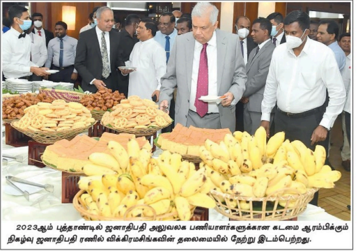
2023ஆம் பூதநாள்புது ஜனாதிபதி அலுவலக பணியாளர்களுக்கான கடமை ஆரம்பிக்கும் நிகழ்வு ஜனாதிபதி ரணில் விக்கிரமசிங்கவின் தலைமையில் நேற்று இடம்பெற்றது.

தேர்தல் செலவை ஒழுங்குபடுத்தல் சட்டமூலம் ஜனவரி 5இல் விவாதம் எந்தவொரு தேர்தலிலும் போட்டியிடும் வேட்பாளர் தனது பிரசாரத்திற்காக செலவிடக்கூடிய அதிகப்பட்ச அங்கீகரிக்கப்பட்ட தொகையை தீர்மானிக்கும் உரிமை, தேர்தல் ஆணைக்குழுவிடமிருந்து வழங்கப்படவுள்ள தேர்தல் செலவீனங்களை ஒழுங்குபடுத்தும் சட்டமூலம் ஜனவரி 5 ஆம் திகதி விவாதிக்கப்படும்... 02 பக்கம்