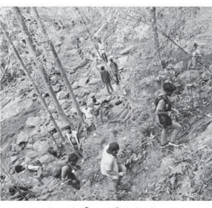
வருவதுடன் ஆற்று நீரை மனிதர்கள் தங்களை தேவைக்குக்காகப் பயன்படுத்த முடியாத

(ஏ.ஏ.எம்.பாஸில்) காலத்தைப் பார்த்து ஒட்டி வேகம் ஆற்றிய இடம்பெற்ற வருகை சட்டவிரோத இரத்தினக்கல் அகழ்வால் இந்த ஆற்று நீரைக் குடிநீராகவும் ஏவலைய தேவைக்குக்கும் பயன்படுத்த முடியாத நிலை ஏற்பட்டுள்ளது. இப்பிரதேசப் பொதுமக்கள் முறைப்பாடு செய்துள்ளனர். இப்பிரதேச ஆற்றுக்கரைவாழ் மக்களின் குடிநீர் மற்றும் ஏவலைய தேவைகள் இந்த ஆற்றின் நீராகவே நிறைவேற்றப்பட்டு வருகிறது. இவ்வெயில் இரத்தினக்கல் அதிகார சபையின் அனுமதிப்படி மற்றும் - பெற்றாலும் ஆற்றின் நடுவிலும் ஆற்றுக்கரை ஏராளமும் இரத்தினக்கல் அகழ்வில் ஈடுபட்டுவதால் ஆற்றுக்கரைகள் இடிந்து விழுந்துள்ள காரணத்தால் வருஷம் தான். இதனால் ஆற்று நீர் நேரம் மாறி விடுவதாகவும் சுற்றாடல் மாசடைந்து