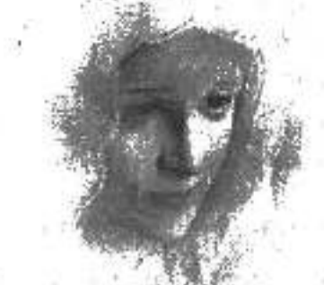
யாழ்ப்பாண - வரலாற்றைப் பார்த்தால் கிறிஸ்தவர்கள் அன்னையினை அழைக்காத அன்பும் நம்பிக்கையும் கொண்டிருந்ததை நாம்

உணர் முடிவற்று அதே நிலையை நாம் இன்று கைக்கொண்டுள்ளோம் யாழ்ப்பாணத்தில் ஆயிரக்கணக்கான ஆவர்கள் அன்னைக்கு அன்பணம் செய்யப்பட்டுவருகிற இடமாக உள்ளது.