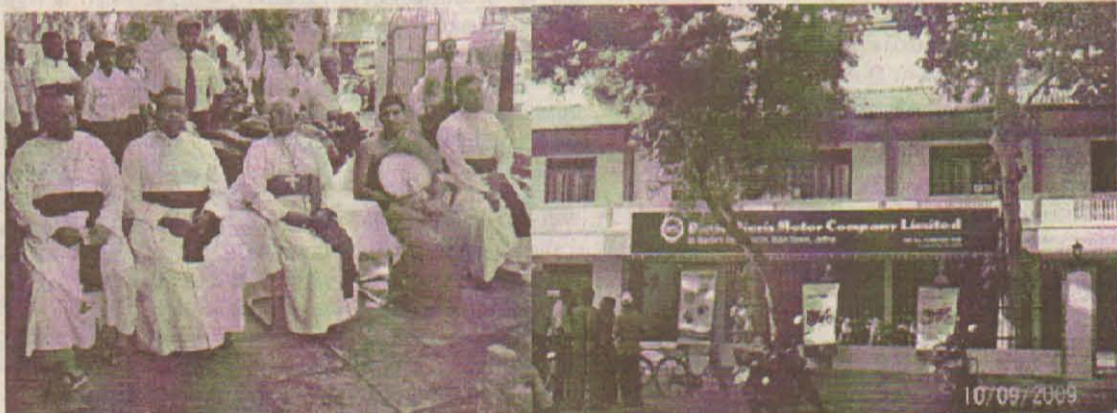
2005ம் ஆண்டு ஆரம்பிக்கப்பட்ட இக்கட்டிடப்பணியானது கால நெருக்கத்தின் விளைவால் தடைப்பட்டிருந்தது. தற்போது அது முழுமையடைந்திருக்கிறது. இது யாழ் திருச்சபையின் தேவைகள் சிலவற்றை பூர்த்தி செய்யும் ஒரு முயற்சியாகக் கொள்ளப்படுகிறது.

யாழ் பிரதான வீதியில் அமைந்துள்ள புனித மடுத்தினார் குருமட வளாகத்தின் ஒரு பகுதியில், ஒரு வர்த்தக மையக் கட்டடத்தொகுதி அமைக்கப்பட்டு அண்மையில் யாழ் ஆயர் அவர்களால் திறந்து வைக்கப்பட்டது.