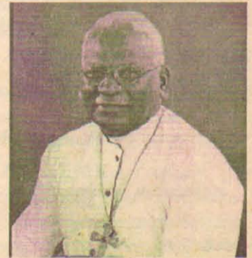
எடுக்குமாறு ஆயர் கோரிக்கை விடுத்துள்ளார்.

விட ஊரணி புனித அந்தோனியர் ஆலயம், பலாலி புனித செபஸ்டியர் ஆலயம், வசாவிலுள்ள கார்மேல் மாதா ஆலயம், ஓட்டகப்புலம் புனித மரியாள் ஆலயம், புனித யாகப்பர் ஆலயம், தோலகட்டி புனித மரியாள் ஆலயம், காங்கேசன் துறை புனித குசையப்பர் ஆலயம், வளலாய் புனித மரியாள் ஆலயம் ஆகியவற்றை புனரமைத்து வழிபடத் திறந்துவிட நடவடிக்கை