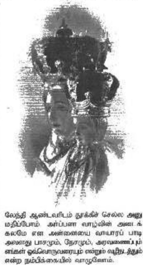
வேந்தி ஆண்டவரிடம் தூக்கிச் செல்ல அனு மதியப்பாம் அர்ப்பணை வாழ்வின் அடைக்கலமே என அன்னையை வாயாரப் பாடி அள்ளது பாசமும், நேசமும், அரவணை உள் எங்கள் ஒப்பொருளுடையம் என்றும் வழிபடுதல் என்ற நம்பிக்கையில் வாழுவோம்.

லாம். ஆனால் அன்னையின் மாண்பினை மதிக்காத மனிதர்கள் பலரையும் எங்கள் மத்தியில் காணமுடிவிறது. அருள் நினைந்தவன், அடைக்கலம் தருபவன்; ஆண்டவரின் தம், அனைத்து மக்களினதும் தாயாளவன்; இரக்கம் நிறைந்தவன்; இடைவிடாது நியானப்பவன்; தாழ்ச்சியின் சீர்தமாளவன்; தாய ஆலியின் பதவினிப்பானவன்; விபாசு வங்களை ஏற்றவன்; சிவ்வை மண்ணைக் அரகியானவன்; என விவிலியம் போற்றும் அன்னையை குறைத்துப் பேசுபவர்களுக்கு நாம் தகுந்த விளக்கம் கொடுக்க முன்வர வேண்டும். வார்த்தைக்கு உயிர் கொடுத்து, இறைவனின் திட்டத்தில் தலியிடம் பெற்று, மீய் வரலாற்றிலே இயேசுவோடு இணைந்து செயலாற்றிய அன்னையின் மக்கமையை உலகிற்கு உணர்த்த வேண்டியது அன்னையின் பிள்ளைகளாகிய எமது கடமைபாகும். அன்னையின் விசுவாசம், அர்ப்பணை, ஏழ்மை, துணிவு, மீட்டும் பணியில் ஈடுபாடு, பரிந்துரை, புண்ணிய வாழ்வு போன்றவை எமது உள் எங்களிலும் இருப்பிடம் கொள்ள வேண்டும். "ஆகட்டும்" என்ற வாழ்த்தையினால் தன்னை ஆண்டவருக்கு கொடுத்த அன்னை மரியாளை முன்னுதாரணமாகக் கொண்டு, நாங்களுக்கும் எங்களை ஆண்டவருக்கு முற்றுமுழுதாக ஒப்பிக்கொடுக்க முன்வருவோம். ஆண்டவர் இயேசுவை ஆவயத்திற்கு கொண்டு சென்றது போல எங்களையும் அன்னை தன் கரத்தி