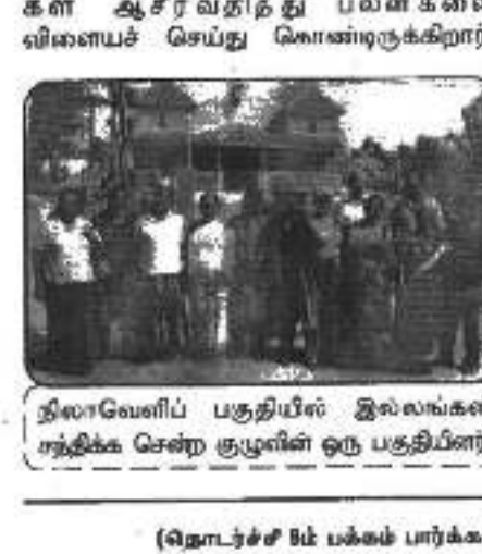
நிலாவெனிப் பகுதியில் இல்லங்கள் சந்திக்க சென்ற குழுவின ஒரு பகுதியினர்.