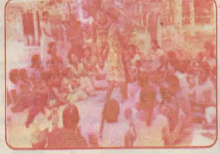
நிலாவெளி பகுதி சிறுமிகளை மகிழ்வித்து அவர்களின் சோகங்களை அறிந்து கொள்ளும் இளம் பெண்கள் பிரசீடிய சகோதரிகள்.