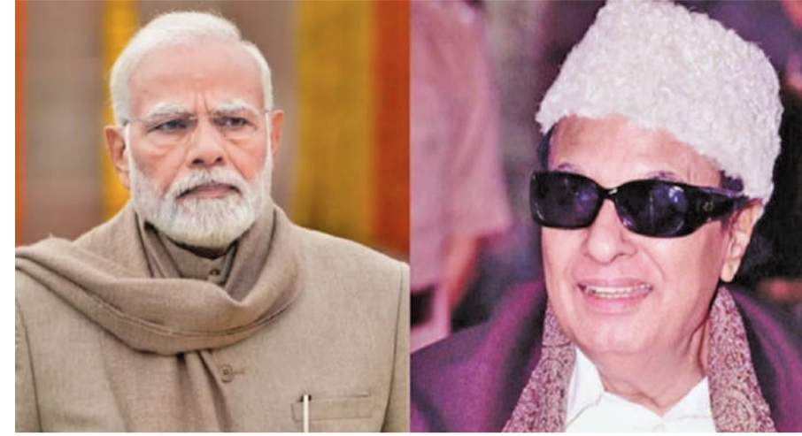
தின. அவர் வெள்ளித்திரைக்கு அப்பால் மக்களின் இதயங்களை வென்றெடுத்தார். ஒரு தலைவராக, முதல்வராக அவர் மக்கள் நலனுக்காக அயராது உழைத்தார். தமிழகத்தின் வளர்ச்சியில், மேம்பாட்டில் நீங்காத தடம் பதித்தவர். அவருடைய பணிகள் இன்றளவும் நம்மனைக்குவிக்கக் கூடியவை" என்று தெரிவித்துள்ளார்.

தவிராக இன்றளவும் போற்றப்படுகிறார். இந்தநிலையில் எம்.ஜி.ஆரின் 107 ஆவது பிறந்த நாளை முன்னிட்டு நேற்று அரசியல் தலைவர்களாலும், தொண்டர்களாலும் அவர் நினைவுகூரப்பட்டார். இது தொடர்பாக பிரதமர் நரேந்திர மோடி எக்ஸ் சமூக வலைதளத்தில் வெளியிட்டிருள்ள பதிவில், "அமரர் எம். ஜி.ஆரின் பிறந்தநாளன்று நாம் அவருடைய வாழ்க்கையை நினைவுகூர்ந்து அனுஷ்டிப்போம். அவர் தமிழ் சினிமாவின் உண்மையான அடையாளம். தொலைநோக்குப் பார்வை கொண்ட தலைவர். அவருடைய திரைப்படங்கள் சமூகநீதியையும், பிறர் துன்பத்தைக் கண்டு விலகாமல் துணை நிற்கும் உணர்வுகளையும் கடத்தினர். அவர் வெள்ளித்திரைக்கு அப்பால் மக்களின் இதயங்களை வென்றெடுத்தார். ஒரு தலைவராக, முதல்வராக அவர் மக்கள் நலனுக்காக அயராது உழைத்தார். தமிழகத்தின் வளர்ச்சியில், மேம்பாட்டில் நீங்காத தடம் பதித்தவர். அவருடைய பணிகள் இன்றளவும் நம்மனைக்குவிக்கக் கூடியவை" என்று தெரிவித்துள்ளார்.