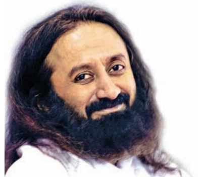
குருதேவர் ஸ்ரீ ஸ்ரீ ரவிசங்கர்

அயோத்தியில் இராமர் கோயில் கும்பாபிஷேகத்துக்காக நாடு தயாராகி வருகிறது. நீண்ட காலமாக எதிர்பார்க்கப்பட்ட கனவு நனவாகி உள்ளது. உச்சநீதிமன்றம், பிரதமர் மோடி மற்றும் அனைத்து தொட்புள்ளவர்களும் அதை நிறைவேற்றுவதில் ஆற்றிய பங்கை பாராட்ட வேண்டிய நேரம் இது. அயோத்தியில் உள்ள இராமர் கோயிலைச் சுற்றியுள்ள கதை சுவாரசியமானதும், மர்மங்கள் நிறைந்ததும் ஆகும்.