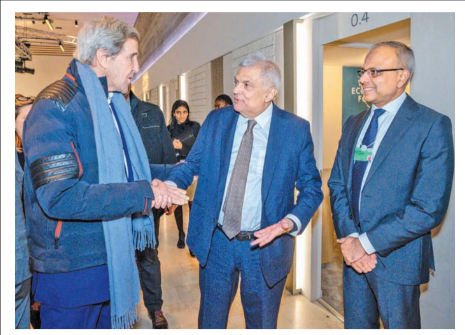
சுவிட்சர்லாந்தின் டாவோஸ் நகரில் உலகப் பொருளாதார மாநாட்டுடன் இணைந்ததாக ஜனாதிபதி ரணில் விக்கிரமசிங்கவுக்கும் காலநிலை மாற்றம் தொடர்பான அமெரிக்க ஜனாதிபதியின் விசேட பிரதிநிதி ஜோன் கெரிக் (John Kerry) இடையில் சந்திப்பொன்று நடைபெற்றது. பாதுகாப்பு தொடர்பான ஜனாதிபதியின் சிரேஷ்ட ஆலோசகரும் ஜனாதிபதியின் பணிக் குழாம் பிரதானியுமான சாகல ரத்னாயக்கவும் உடனிருந்தார்.