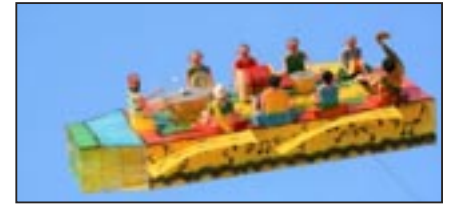
தவில் நாதஸ்வரக் குழுவினர்

இந்து தெய்வங்கள் - முருகன், பிள்ளையார் றொக்கற் பட்டம்