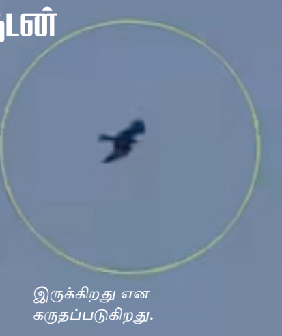
இருக்கிறது என கருதப்படுகிறது.

கிடைத்திருக்கிறது என்று பக்தர்கள் தெரிவித்துள்ளனர். அத்துடன், கடவுள் ராமர் அங்குதான் இருக்கிறார் என்பதற்கான அறிகுறி இது என்றும் நம்பப்படுகிறது. பக்தி மற்றும் ஆன்மிக உணர்வால் வளிமண்டலம் சூழ்ந்துள்ளதால், இது நல்ல அதிர்ஷ்டத்தின் அறிகுறியாகவும், கோயிலின் எதிர்காலத்துக்கான நேர்மறையான சகுனமாகவும்