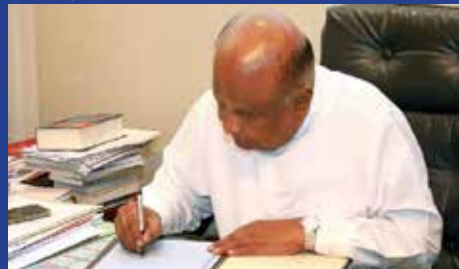
யிட்டுள்ள அறிக்கையில் தெரிவிக்கப்பட்டுள்ளது.

இதனையடுத்து, அவை சட்டங்களாக அமுலுக்கு வந்துள்ளன என நாடாளுமன்ற தொடர்பாடல் பிரிவு வெளி