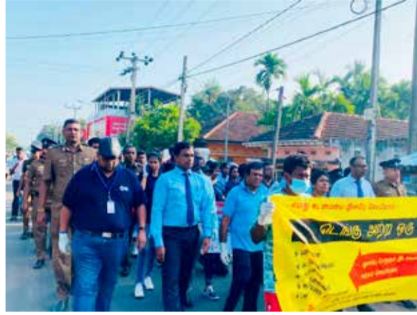
யாழ்ப்பாணம், ஜன. 25

யாழ்ப்பாணம் மாவட்டத்தில் அதி கரித்து வரும் டெங்கு நோயை கட்டுப்படுத்தும் நோக்கில் விழிப்புணர்வு நடைபவனி நேற்று புதன்கிழமை நடைபெற்றது.