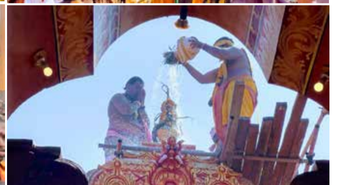
வரலாற்று பிரசித்தி பெற்ற நயினாதீவு நாகபூசணி அம்மன் ஆலயத்தின் மகா கும்பாபிஷேகம் நேற்று நடைபெற்ற போது எடுக்கப்பட்ட படங்கள்.