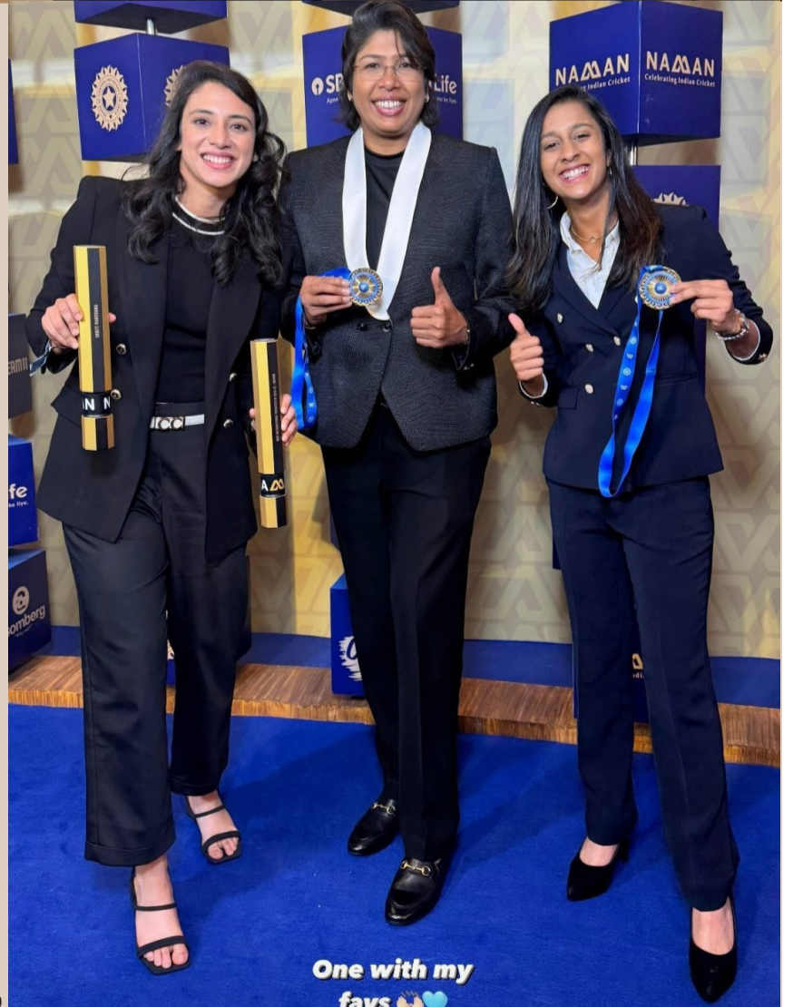
One with my favs

மேற்கு இந்தியா) சி.கே. நாயுடு வாழ்நாள் சாதனையாளர் விருது: 1. ரவி சாஸ்திரி மற்றும் பருக் என்ஜினீயர் இதையும் படிங்க: முதல் 2 போட்டிகளில் அவர் ஆடாததும் நமக்கு ஒருவகையில் நல்லது தான் - ராகுல்திராவிட் அளித்த பேட்டி இந்த விழாவில் பி.சி.சி.ஐ தலைவர் மற்றும் முன்னாள் வீரர் ரோஜ் பின்னி செயலாளர் ஜெய் ஷா ஆகியோர் சிறப்பு விருந்தினர்களாக இருந்து விருதுகளை வீரர்கள் மற்றும் வீராங்கனைகளுக்கு வழங்கினார்கள். அந்த நிகழ்ச்சியை பிரபல தொகுப்பாளர் ஹர்ஷா போக்லே தொகுத்து வழங்கிய நிலையில் இந்திய கப்டன் ரோஹித் சர்மா, முகமது சிராஜ் போன்ற அனைத்து வீரர்களும் பயிற்சியாளர் ராகுல் திராவிட் ஆகியோரும்