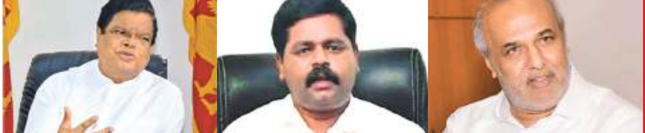
அமைச்சர் பந்துலு குணவர்தன

முன்வைத்தனர். ஆனால் ஆளும் கட்சியினர் தொடர்ந்தும் எதிர்ப்பு வெளியிட்டதால் அமளிதுமளி ஏற்பட்டது. இதன்போது படைக்கள சேவிதர்கள் உள்ளிட்டோர் செங்கோலுக்கு பாதுகாப்பு வழங்கினர். அதேவேளை சபை முதல்வர் திருத்தங்களை முன்வைக்க ஆளும் கட்சியின் எம்.பிக்கள் அவரை கும்புத்கொண்டு அவருக்கு பாதுகாப்பு வழங்கி அவரைத் தொடர்ந்தும் திருத்தங்களை முன்வைக்க உதவினர். எனினும் சபையில் எதிர்க்கட்சியினர் சபைக்கு மத்தியில் வந்து தமது கருமும் எதிர்ப்புகளை வெளியிட்டனர். எதிர்க்கட்சியினரின் எதிர்ப்புகளுக்கு மத்தியில் திருத்தங்கள் முன் வைக்கப்பட்ட சட்ட மூலம் சபையில் நிறைவேற்றப்பட்டது.