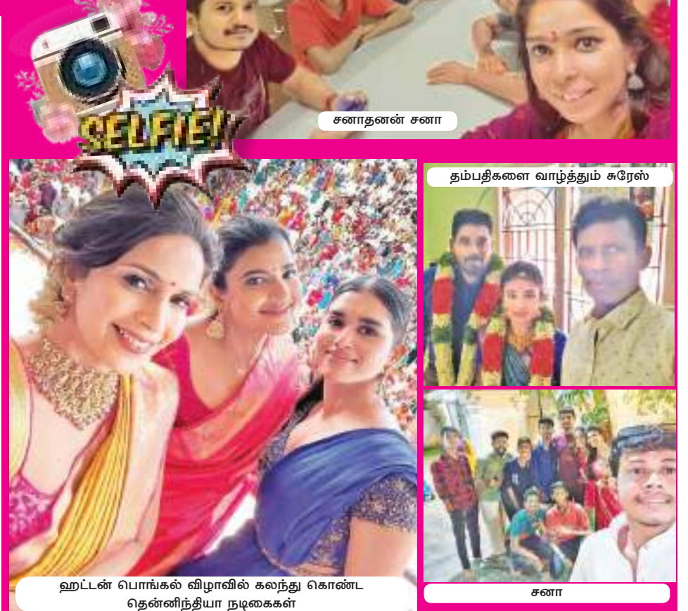
ஹட்டன் பொங்கல் விழாவில் கலந்து கொண்ட தென்னிந்தியா நடிகைகள்

அந்த அளவிற்கு வசதியான நவீன நிறுவனமாக இதனை நாம் கட்டமைத்துள்ளோம். இங்கு சாதாரண விலையிலான மீன்கள் முதல் மிக விலையுயர்ந்த மீன்களும் அதேபோன்று சாதாரண விலை முதல் மிக பெரிய விலையிலான பறவைகளும் எம்மிடத்தில் உள்ளன. விரைவில் ஏனைய பல செல்லப்பிராணிகளையும் கொண்டு வருவதற்கான ஏற்பாடுகளையும் மேற்கொண்டுள்ளோம். எனவே வாடிக்கையாளர்கள் சிறந்த ஒரு அனுபவத்தை பெற்றுக் கொள்ள இலக்கம் 03, நீர் கொழும்பு வீதி, ஒலியமுள்ள என்ற எமது நிறுவனத்திற்கு வருமாறு அழைப்பு விடுக்கின்றோம்.