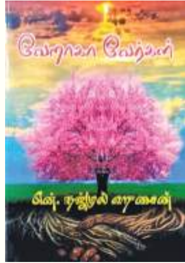
பிரபல திரைப்பட இயக்குனர், தயாரிப்பாளர், கதாசிரியர், நூலாசிரியர், கலாபூஷணம்