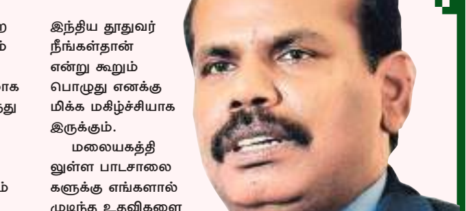
இந்திய துதுவர் நீங்கள்தான் என்று கூறும் பொழுது எனக்கு மிக்க மகிழ்ச்சியாக இருக்கும்.

சப்ரகமுவ , வடமேல் ஆசிய மாகாணங்களில் வாழ்கின்றனர். அதேவேளையில் வடக்கு கிழக்கு மாகாணங்களிலும் ஒரு தொகையினர் வாழ்கின்றனர். இவற்றை அவகாணிக்கும் பொழுது எனக்கு சந்தோசமாக இருக்கின்றது. நாங்கள் எல்லோரும் இந்தியாவில் இருந்து வந்தவர்கள் என்று அவர்கள் என்னிடம் வந்து கூறும் போது, ஆம், இவர்கள் எங்களுடைய தொடர்புள்ள கொடி உறவுகள் என்றுதான் நான் கருதுவேன்.