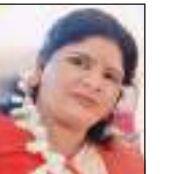
வினா நபராஜா தாமரைச் செல்வி... கூ

"என் பிள்ளை முன்பெல்லாம் அப்படியல்ல. இப்போது சொன்னாலும் அவனுடைய பேச்சு வழக்கு சரியில்லை எங்கு படித்தானோ" என்று நம் குழந்தையின் தவறை நிறுத்தாமல் யாரவது அவர்களுடைய நட்பு வட்டத்தினுள் திணிக்க பார்க்கிறோம். 15,16 வயதுக்கு பின் அவர்கள் யாரோ நாம் யாரோ என்கிற நிலையை பெற்றோராகிய நாமே உருவாக்கி விட்டு அது புரியாமல் தவிப்போம். பெற்றோராகிய நாம் திருத்திக்கொள்ள வேண்டிய விடயங்கள் ஏராளம் உண்டு. அதாவது பிள்ளைகளை வளர்க்கும் தகுதியை நாம் வளர்த்துக்கொள்ள வேண்டும் என்பதே மறுக்க முடியாத உண்மையாகும்.