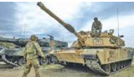
கொள்வனவாளர்களில் ஒன்றாக உள்ளது. அதே போன்று ஜெர்மனி மற்றும் செக் குடியரசும் அதிக ஆயுதங்களை வாங்கியுள்ளன.

தனது இராணுவத்தை விரிவுபடுத்தி வரும் உக்ரைனின் அண்டை நாடான போலந்து மிகப்பெரிய