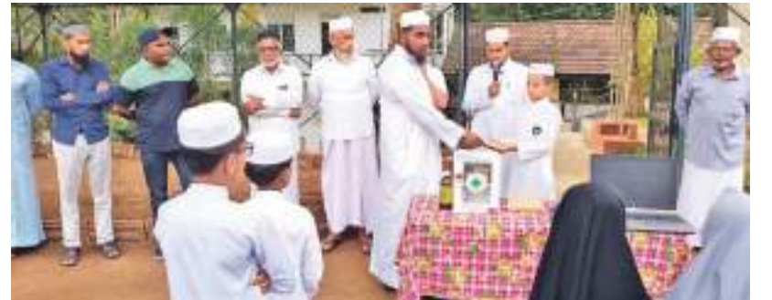
கண்டி மாவட்டத்தைச் சேர்ந்த கும்புக்கந்துறை கே.ஏ.எச். அறையியாப் பாடசாலையில் இடம்பெற்ற வைபவமொன்றில் மாணவர்கள் கௌரவிக்கப்பட்டனர். மனவளவியல் யூசப் இஸ்மாயில் உட்பட பலர் இதில் அத்திகளாக கலந்துகொண்டனர். மாணவரொருவரை பரிசு பெறுவதைப் படத்தில் காணலாம்.