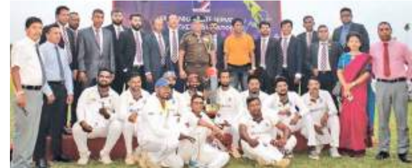
இலங்கை அரங்கேற்றம் சம்பந்தமாக நடைபெற்ற முன்னணி அணிகளில் ஒன்றான வெகுசன ஊடக அமைச்சர் அணியினர் மற்றும் பங்கேற்ற அதிகாரிகளை படத்தில் காணலாம். இவர்களுக்கான வெற்றிக் கிண்ணத்தை ஊடக அமைச்சர் மேலதிக செயலாளர் என்.ஏ.கே.எஸ் விஜேநாயக்க வழங்கினார்.

இலங்கை மற்றும் ஆப்கான் அணிகளுக்கு இடையிலான ஒரே ஒரு டெஸ்ட் போட்டிக்குப் பின்னர் இரு அணிகளும் மூன்று ஒருநாள் மற்றும் மூன்று 120 போட்டிகளில் ஆடவுள்ளன. ஒருநாள் போட்டிகள் பல்வேகலிலும் 120 போட்டிகள் தம் புள்ளையிலும் நடைபெறவுள்ளன.