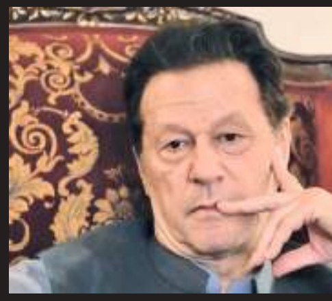
இம்ரான் காள் போட்டியிடுவது தடுக்கப்பட்ட பாசிஸ்தான் பொதுத் தேர்தல் ஒரு வாரத்தில் இடம்பெறவுள்ள நிலையில் இரகசியங்கள் சட்டத்தின் கீழ் அவர் குற்றங்காணப்பட்டுள்ளார்.

அரசு இரகசியங்களை கசியவிட்ட வழக்கில் பாசிஸ்தான் முன்னாள் பிரதமர் இம்ரான் காணுக்கு 10 ஆண்டுகள் சிறைத் தண்டனை விதிக்கப்பட்டுள்ளது. 2022 ஆம் ஆண்டு பாதுகாப்பு சட்டத்தின் கீழ் வெளியேற்றப்பட்ட இம்ரான் காள், ஏற்கனவே ஊழல் குற்றச்சாட்டில் மூன்று ஆண்டு சிறை அனுபவித்து வருகிறார். எனினும் தன் மீதான அனைத்துக் குற்றச்சாட்டுகளும் அரசியல் நோக்கம் கொண்டவை என்று அவர் குறிப்பிட்டுள்ளார்.