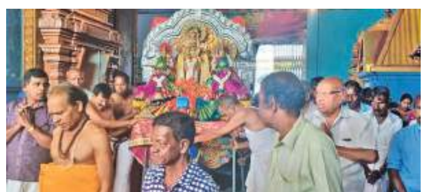
கண்டி மாவட்டத்தைச் சேர்ந்த மெதமநுவர முருகாமலை ஆலயத்தில் நடைபெற்ற தைப் பூசம் நிகழ்வின் போது எடுக்கப்பட்ட படம்.

28 ஆம் திகதி இரவு நுவரெலியா பொலிஸாரால் சந்தேகத்தின் பேரில் கைதுசெய்யப்பட்டிருந்தார். இவரிடமிருந்து 05 கிராம் மற்றும் 100 மில்லிகிராம் போதைப்பொருள் மீட்கப்பட்டதுடன் கைத்தொலைபேசியொன்றும் மீட்கப்பட்டுள்ளதாக தெரியவந்துள்ளது. இது தொடர்பில் மேற்கொண்ட விசாரணைகளின்போது, சந்தேகநபர் வாட்ஸ்அப் ஊடக போதைப்பொருள் விற்பனையில் ஈடுபட்டுவந்துள்ளமை தெரியவந்துள்ளது. சந்தேகநபரை பொலிஸார் நீதிமன்றில் ஆஜர்படுத்தியபோது பெப்ரவரி (02) வரை தடுப்புக்காவலில் வைத்து விசாரணை செய்யுமாறு உத்தரவிட்டுள்ளது. (ஆ.ரமேஷ்)