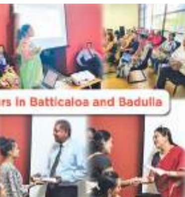
Entrepreneurs in Batticaloa and Badulla

பொருளாதாரத்திற்குப் பங்களிக்கும் வெற்றிச் சரித்திரங்களாக மாற்றுவதற்கான இலவச வணிக ஆலோசனை உதவி மற்றும் அறிவுப் பகிர்வு DFCC வங்கி அவர்களுக்கு வழங்கி வருகின்றது. முன்னுரிமை வட்டி வீதங்கள், சலுகைக் கட்டணங்கள் மற்றும் தரகுப் பணங்களை பிரதிநிதிகளாக பெண் தொழில் முயற்சியாளர்கள் மற்றும் நுகர்வோருக்கு வழங்கி, வங்கித்துறையில் அவர்களது ஈடுபாட்டை ஊக்குவித்து, அனுசரணையளிப்பதில் DFCC ஆலோசனைத்துவம் மிக்கது. இலங்கையில் பெண்களுக்கு சொந்தமான வணிகங்கள் மற்றும் பெண்கள் மத்தியில்