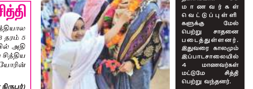
கல்முனை அல் ஸுஹரா வித்தியாலயத்தில் முதல் தடவையாக 09 மாணவர்கள் வெட்டுப்புள்ளிகளுக்கு மேல் பெற்று சாதனை படைத்துள்ளனர். இதுவரை காலமும் இப்பாடசாலையில் 4 மாணவர்கள் மட்டுமே சித்தி பெற்று வந்தனர்.