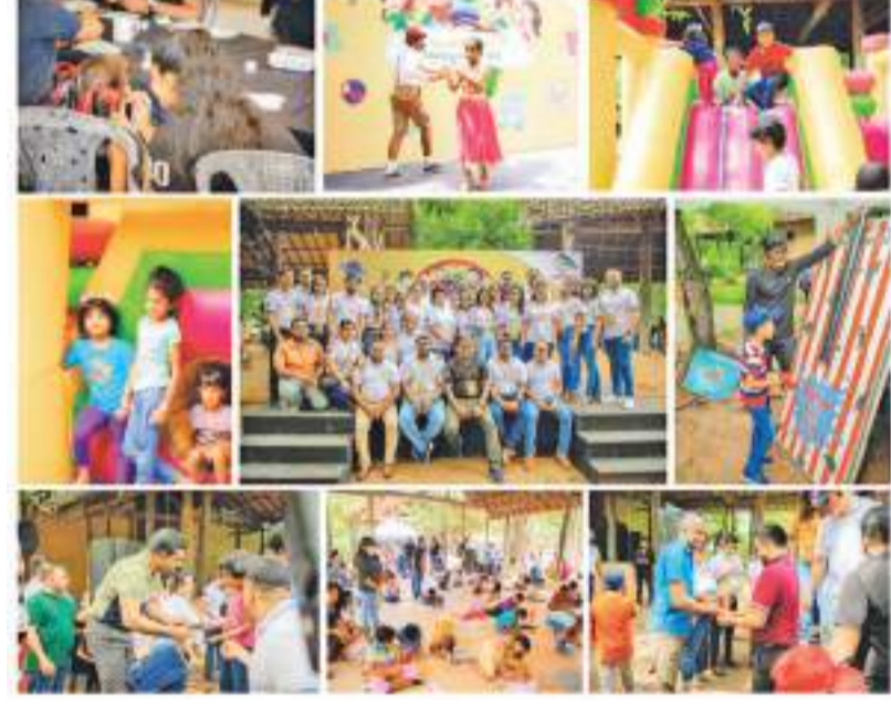
நடவடிக்கைகளை உள்ளடக்கியிருந்ததுடன், ஒவ்வொரு குழந்தையும் விரும்பும் ஏதாவது ஒன்றைக் கண்டறியும் வகையில் உறுதி செய்தது.

Sunshine Holdings PLC அண்மையில் Battaramullaவில் உள்ள Ape Gama வளாகத்தில் சர்வதேச சிறுவர்கள் தினத்தை கொண்டாடியது. இந்த நிகழ்வு 16 வயதுக்குட்பட்ட SUN ஊழியர்களின் குழந்தைகளுக்கு ஒரு அன்பான சந்தோஷம் தந்த தருணமாக இருந்தது. அவர்கள் நான் முழுவதும் வேடிக்கை, படைப்பாற்றல் மற்றும் பொழுதுபோக்கு அம்சங்களிலும் ஈடுபடுத்தப்பட்டனர். Sunshine Holdings PLC குழந்தைகளின் திறன் மற்றும் வாக்குறுதியின் மீது வலுவான நம்பிக்கை கொண்டுள்ளது. அவர்களை ஒரு ஆசிரியர் வாழ்க்கைப் பிரகாசமான எதிர்காலத்திற்கான நம்பிக்கையாகவும் கருதுகிறது. சர்வதேச சிறுவர்கள் தின கொண்டாட்டம் இந்த உறுதிப்பாட்டிற்கான ஒரு சான்றாக இருந்தது, பெற்றோர்களுடன் சேர்ந்து குழந்தைகள் உற்சாகம் மற்றும் மகிழ்ச்சியால் நிரப்பப்பட்ட நாளில் பங்கேற்க கூடியவர். இந்த நிகழ்வு பல்வேறு வகையான