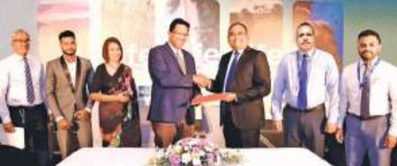
செய்வது மற்றும் சுற்றாடல் பாதுகாப்பு என்பது இலங்கைக்கு மிகவும் முக்கியமானது. இலங்கை பிரதேசங்களில் இருந்தும் சமூகத்தின் பயனாளிகள் மத்தியில் இருந்து இதற்கென தெரிவு செய்யப்படும் கரையோர பராமரிப்பு குடும்பத்துக்கு உரிய மாநாந்த கொடுப்பனவு, தேவையான உபகரணங்கள் மற்றும் பொருள்கள் கரையோர பராமரிப்பை மேற்பார்வை செய்தல் என்பனவற்றை கொமர்ஷல் வங்கி மேற்கொள்ளும்.

நிலையத்துக்கு எதிராக உள்ள கருத்துரை பீச் பார்க் பிரதேசத்தின் 500 மீட்டர் பரப்பளவு இந்தத் திட்டத்தின் கீழ் கொண்டு வரப்படும். எமது கடற்கரைகளுக்கு வாழ்வு என்ற இந்தத் திட்டம் கரையோர சுற்றாடல் பாதுகாப்பு அதிகார சபை Marine Environment Protection Authority (MEPA) சமூக அபிவிருத்தி திணைக்களம் (DoSD), இலங்கை உயிர்பன்முக நிறுவனம் மற்றும் கூட்டணமை நிறுவனங்களை ஒருங்கிணைத்து அமுல் செய்யப்படும் ஒரு திட்டமாகும். கடற்கரைகளை சுத்தம் செய்வது, சேகரிக்கப்படும் கழிவுகளை முறையாக அகற்றுவது அதன் மூலம் தேசிய உயிர்பன்முக இலக்குகளை அடைந்து கொள்ள பங்களிப்புச்