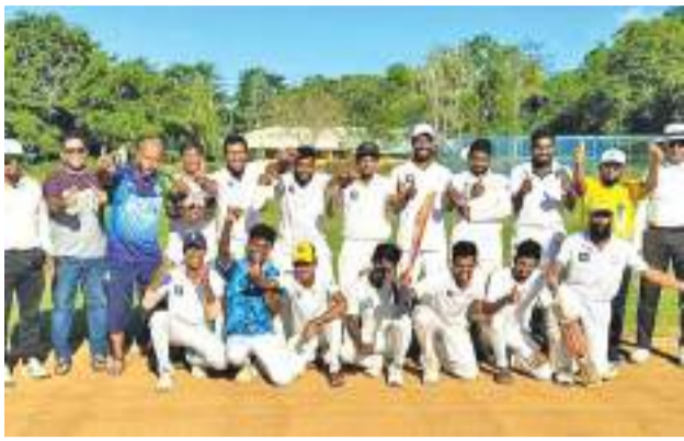
ஏறாவூர் சுழற்சி நிரூப

இலங்கை கிரிக்கெட் சபையினால் நடாத்தப்படும் பிரிவு 2 போட்டியின் இறுதிப் போட்டியில் ஏறாவூர் யங் அல் ஹீரோஸ் விளையாட்டுக் கழகம் கிழக்கு மாகாண சம்பியனாக வெற்றியீட்டியது. அண்மையில் அம்பாறை உகை விளையாட்டு மைதானத்தில் நடைபெற்ற இந்த இறுதிப் போட்டியில் ஏறாவூர் யங் அல் ஹீரோஸ் விளையாட்டுக் கழகம் அம்பாறை கிழக்கு ராவ சுகின் கழகத்துடன் மோதியது. முதலில் துடுப்பெடுத்தாடிய அம்பாறை கிழக்கு ராவ சுகின் அணியினர் 39.2