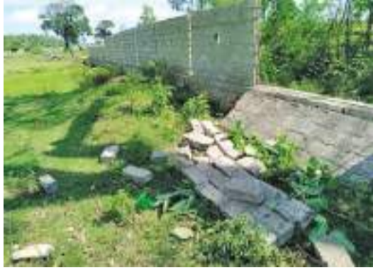
ணிப்பவர்கள் மற்றும் அதனை அன்பித்த பிரதேசங்களில் வசித்து வரும் மக்களையும் அச்சுறுத்தி வருவதாக மக்கள் தெரிவிக்கின்றனர். பீதியின் காரணமாக மக்கள் மாலை நேரங்களில்

பொத்துவில் ஆத்திமுனை கிராமத்திற்குள் தொடர்ச்சியாக அதிகரித்துக் காணப்படும் காட்டு யானைகளின் தொல்லையைக் கட்டுப்படுத்து மாறு மக்கள் கோரிக்கை விடுத்துள்ளனர். வெள்ளிக்கிழமை (17) அதிகாலை ஆத்திமுனை ஹில்ட் நகரத்திற்குள் உட்புகுந்த காட்டு யானை பல்வேறு சேதங்களை ஏற்படுத்தியுள்ளதுடன், அல்லபா பள்ளிவாசலின் வேலியையும் உடைத்துள்ளதாக பகுதி மக்கள் கவலை தெரிவிக்கின்றனர். ஆத்திமுனை பிரதேசத்தில் குப்பை மேட்டில் குவிந்து காணப்படும் திண்மக்கழிவுகளை உட்கொள்வதற்காக குவியும் யானைகள் அப்பகுதில் உள்ள விவசாய பயிர்களையும் மற்றும் பயன்தரும் மரங்களையும் சேதமாக்குவதுடன் வீதியால் பய