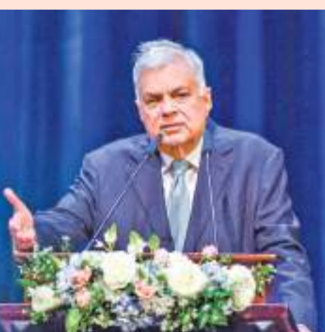
மங்பெத" என்ற சுயசரிதை நூலும் வெளி யிடப்பட்டது. அதிபர்கள் ஆயிரம் பேருக்கு மேற்பட