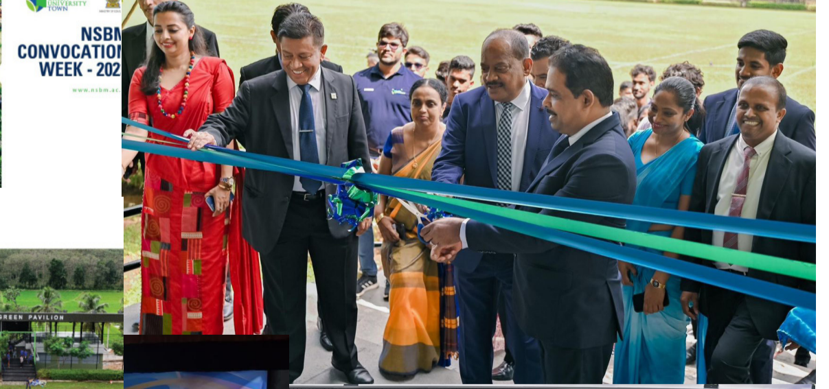
NSBM PHASE II PLAY GROUND