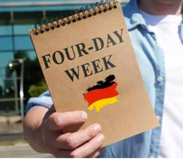
உலகில் பல வளர்ந்த நாடுகள் குறைவான வேலை நேரத்தைக் கடைபிடிக்கின்றன. பெல்ஜியம், நெதர்லாந்து,

டென்மார்க், அவுஸ்திரேலியா, ஜப்பான், ஸ்பெயின், பிரிட்டன் போன்ற நாடுகளில் குறைந்த வேலை நேரங்கள் பரவலாக கடைபிடிக்கப்படுகின்றன. இந்தப் பட்டியலில் தற்போது ஜேர்மனியும் இணைந்துள்ளது.