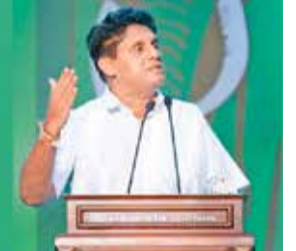
கொழும்பு, பெப். 01 போராட்டங்களை ஒடுக்குவதற்காக பயன்ப

சஜித் பிரேமதாஸ கோரிக்கை டுத்தப்படுகின்ற கண்ணீர் புகை குண்டுகள் மற்றும் இறப்பர் தோட்டாக்களுக்கு ஒதுக்கப்படுகின்ற நிதியை நாட்டின் கல்விக்காக ஒதுக்குமாறு எதிர்க்கட்சித் தலைவர் சஜித் பிரேமதாஸ அரசாங்கத்திடம் வேண்டுகோள் விடுத்தள்ளார். நேற்று மாத்தறையில் இடம்பெற்ற நிகழ்வொன்றில் கலந்து கொண்டு உரையாற்றும் போதே அவர் இவ்வாறு வேண்டுகோள் விடுத்துள்ளார். அவர் மேலும் தெரிவிக்கையில் - அதன்படி ஐக்கிய மக்கள்