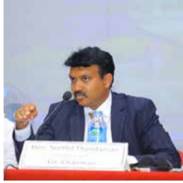
கிழக்கு மாகாண ஆளுநர் ஆலோசனை வழங்கியுள்ளார். (அ)

அம்பாறை மாவட்ட அரசாங்க அதிபருக்கு, வெள்ளத்தினால் சேதமடைந்துள்ள தற்போதைய உட்கட்டமைப்புகளை புனரமைப்பு செய்வதற்கு எவ்வித அனுமதியும் தேவையில்லை எனவும் உடனடியாக செயற்படுமாறும் கிழக்கு மாகாண ஆளுநர் ஆலோசனை வழங்கியுள்ளார். (அ)