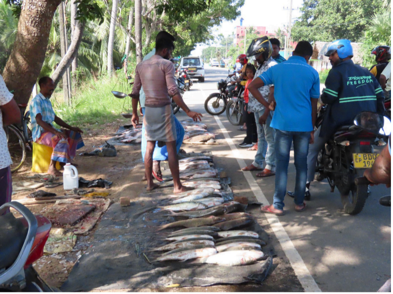
கடந்த சில தினங்களுக்கு முன்னர் ஏற்பட்ட மழை வெள்ளம் காரணமாக கடலை நோக்கி ஓடும் நீரோடைகள் ஆறுகளில் இருந்து 3 வகையான கணையான் வகை மீன்கள் கரைவலை

அம்பாறை, பெப். 02 திடீர் காலநிலை மாற்றம் காரணமாக அதிகளவான கணையான் மீன் இனங்கள் அம்பாறை மாவட்டத்தின் பிராந்திய ஆற்றோரங்களில் பிடிபடுகின்றன.