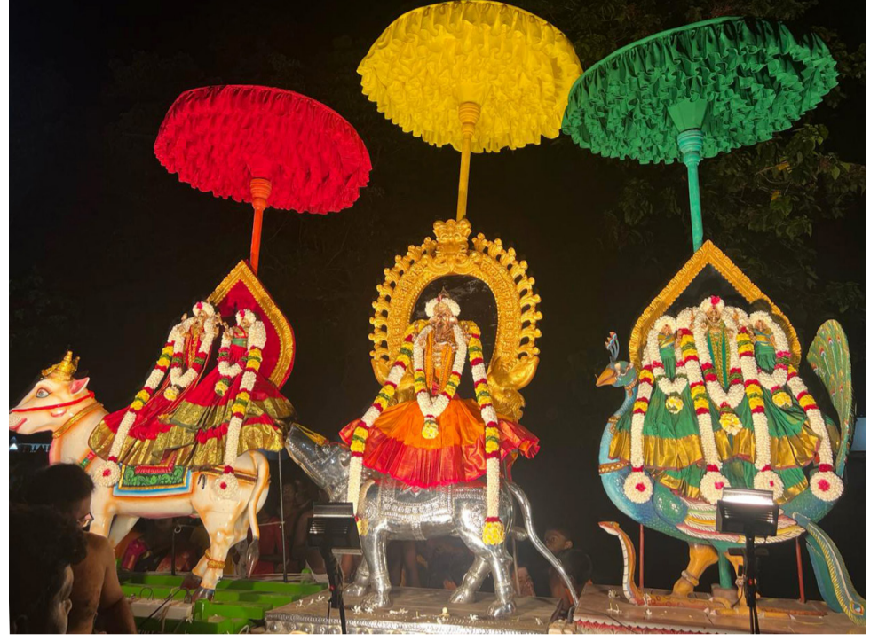
நல்லூர் வடக்கு ஸ்ரீ சந்திரசேகரப் பிள்ளையார் ஆலயத்தில் நேற்றுமுன்தினம் நடைபெற்ற கும்பாபிஷேக தின சகலர் சங்காபிஷேக விழாவின் போது பரிவார மூர்த்திகள் சுகிதம் சுவாமி வெளிவீதியுலா வந்த காட்சி.