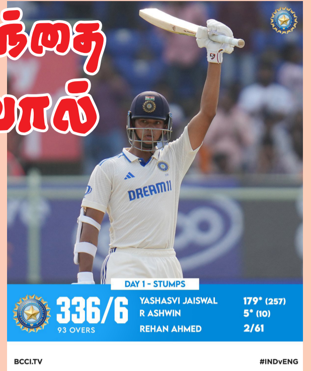
DAY 1 - STUMPS 336/6 93 OVERS YASHASVI JAISWAL 179* (257) R ASHWIN 5* (10) REHAN AHMED 2/61 BCCI.TV #INDvENG

2023 ஆம் ஆண்டு வெஸ்ட் மேற்கு இந்தியாவில் நடைபெற்ற டெஸ்ட் தொடரில்