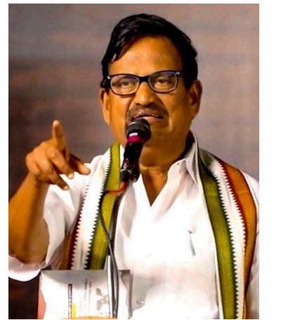
இலங்கை கடற்படையை கண்டித்தும் எதிர்வரும் 10ஆம் திகதி சனிக்கிழமை இராமேஸ்வர கண்டன ஆர்ப்பாட்டம் நடைபெறும் - என்றுள்ளது. (ஐ)

அவர்களின் விடுதலையை வலியுறுத்தியும் மீனவர் விவகாரத்தில் நடவடிக்கை எடுக்காத பா. ஜ. கவை கண்டித்தும்