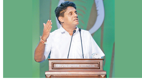
கொழும்பு, பெப். 06

“ அலரிமாளிகை, ஜனாதிபதி மாளிகை என்பன ஐக்கிய மக்கள் சக்தி ஆட்சியில் பல்கலைக்கழகங்களாக மாற்றப்படும்.” - என்று எதிர்க்கட்சி தலைவர் சஜித் பிரேமதாஸ நேற்று அறிவித்தார்.