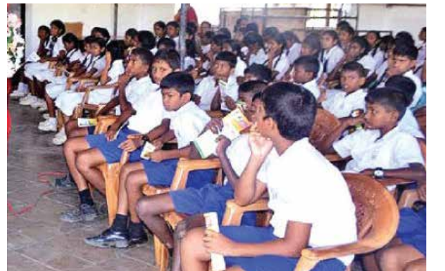
கள் தவறான பாதையில் செல்லாமல் காத்துக்கொள்ள வேண்டியது பெற்றோரின் பொறுப்பு" என்றார். (ரெப-11)

மாணவர்கள், பெற்றோர் சொல் கேளாத நிலையை அடைந்துள்ளனர். அந்தளவிற்கு அவர்கள் ஆவேசமான மன உணர்வில் வன்முறையாளர்களாக மாறிப்போகின்றனர். எனவே, பிள்ளைகளுக்கு மொழைப் ஃபோன் கொடுக்க வேண்டாம். அவற்றின் மூலம் சமூக வலைதளங்களில் கொலைகள், தாக்குதல்கள், பழிவாங்கல்களைப் பார்த்துக்கொள்ள வேண்டாம். பிள்ளையிடம் செல்ஃபோன் கொடுக்கப்பட்டால், அவர்கள் என்ன செய்கிறார்கள் என்பதை கண்காணியுங்கள். மேலும், வீடியோ கேம்களை விளையாட அனுமதிக்காதீர்கள். இத்தகைய பழக்கங்களால் குழந்தைகள் வன்முறையில் ஈடுபடுகின்றனர். ஆகவே, பிள்ளை