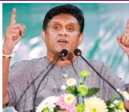
தும பண்டார மேலும் குறிப்பிட்டுள்ளார். (ரெப-13)

எதிர்க்கட்சித் தலைவருக்கு பல தடவைகள் மேற்படி அழைப்பு விடுக்கப்பட்டதாகவும், அதற்கமைய சஜித் பிரேமதாச தனது அத்தியாவசிய வேலைகளை முடித்துக் கொண்டு இந்தியாவுக்குச் செல்லவுள்ளதாக ரஞ்சித் மத்