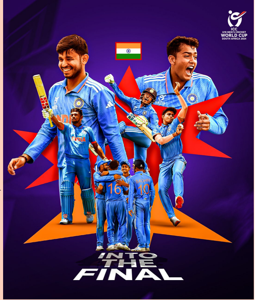
கோப்பைகளை வென்ற அவுஸ்திரேலியாவை போல அண்டர்-19 கிரிக்கெட்

அந்த வகையில் சீனியர்கிரிக்கெட்டில் 6 உலகக்