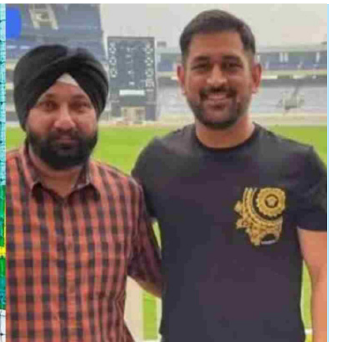
துடுப்புக்கு முதல் முறையாக ஸ்பான்சர்ஷிப்பை பெற்றுக் கொடுத்த பரம்பித் செய்த உதவியை மறக்காத டோனி தற்போது அவருடைய