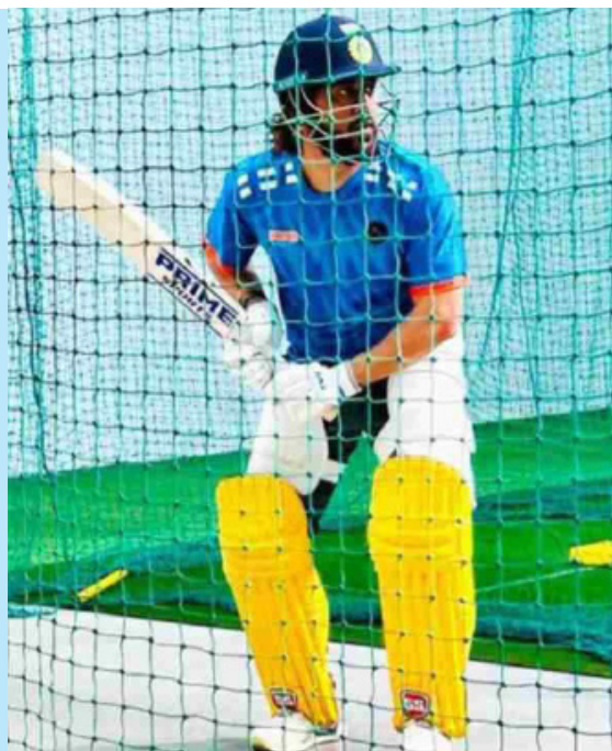
நண்பர் ராஞ்சியில் பிரைம் ஸ்போர்ட்ஸ் எனும் விளையாட்டு உபகரணங்கள் கையை நடத்தி வருகிறார்.