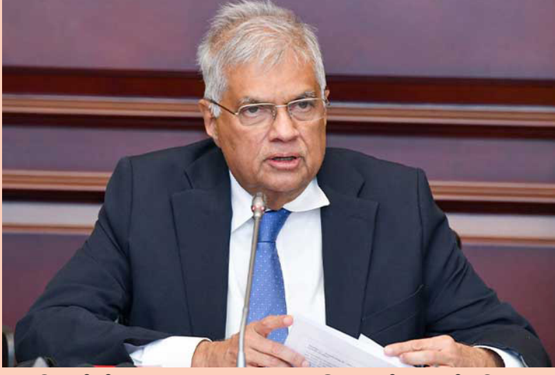
வெளிவிவகார அமைச்சர் பென்னி வெங்கிர்க்கும்

இதேவேளை, இந்த விஜயத்தின் போது ஜனாதிபதி ரணில் விக்கிரமசிங்கவிற்கும் அவுஸ்திரேலிய