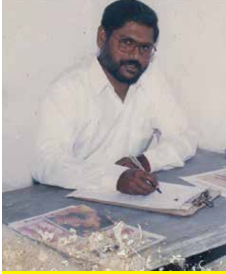
32 வயதில் (2002)