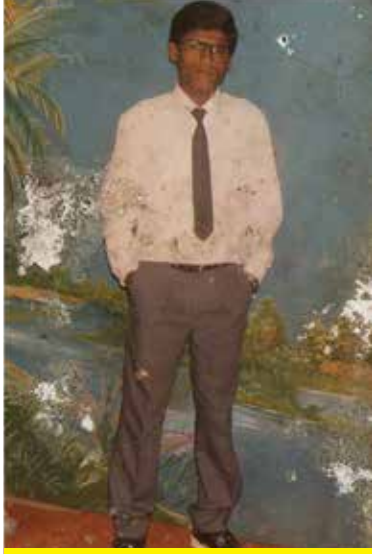
21 வயதில் (1991)