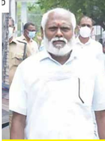
54 வயதில் (2003)