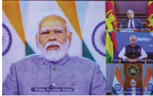
இலங்கை வரும் இந்திய சுற்றுலாப்பயணிகளுக்கு கியூ.ஆர். குறியீடு

பணம் செலுத்தும் முறையை அறிமுகப்படுத்தும் நிகழ்வில் இந்திய பிரதமர் நரேந்திர மோடியும் நிகழ்நிலைத் தொழில்நுட்பம் மூலம் இணைந்து கொண்டார். நிகழ்வு ஜனாதிபதி ரணில் விக்ரமசிங்க தலைமையில் ஜனாதிபதி செயலகத்தில் இடம்பெற்றது. என்பிசிஐ இன்டர்நாஷனல்