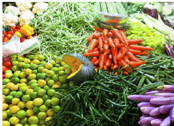
500 முதல் 600 ரூபாய் வரை குறைந்துள்ளது. (அ)

அதற்கமைய, மொத்த விலையில் 1,000 முதல் 2,000 ரூபாய் வரை விற்பனை செய்யப்பட்ட ஒரு கிலோ கரட் நேற்று காலை