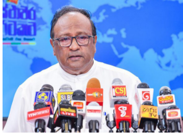
டுப்பதற்கு ஜனாதிபதி பயன்படுத்தக்கூடாது.

ஆராயவில்லை. இது குறித்த கலந்துரையாடலும் இடம்பெறவில்லை. உரிய கலந்தாலோசனைகளை மேற்கொள்ளாமல் இறுதி உடன்படிக்கை குறித்த தீர்மானத்தை எடுக்க முடியாது. எட்கா உடன்பாடு குறித்து ஆளும் பொதுஜன பெரமுன தனது நிலைப்பாட்டை தாமத மின்றி வெளிப்படுத்தவேண்டும். நாட்டில் காணப்படும் அரசியல் சமூக சூழ்நிலைகளை தனது நிகழ்ச்சி நிரலை முன்னெ