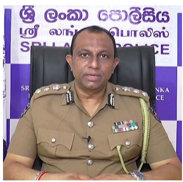
பட்டுள்ள ஆணைக்குழுவை நாங்கள் இதுவரை ஏற்படுத்தவில்லை என பொலிஸ் பேச்சாளர் கூறினார்.

எவரும் இதுவரை நிகழ்நிலை பாதுகாப்புச் சட்டத்தின் கீழ் கைது செய்யப்படவில்லை. அந்த சட்டத்தில் குறிப்பிடப்