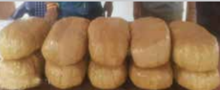
படையினருக்குக் கிடைத்த புலனாய்வு தகவலுக்கமைய நேற்று சம்பவ இடத்

நயினாதீவு கடற்கரையில் கஞ்சா மறைத்து வைக்கப்பட்டுள்ளது என்று முல்லைத்தீவு மாவட்ட விசேட அதிரடிப்