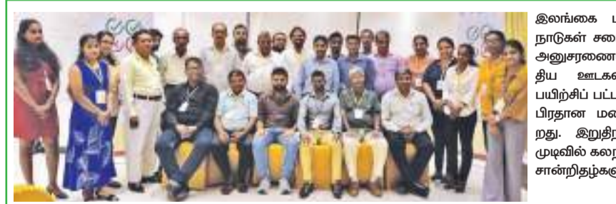
இலங்கை பத்திரிகை பேரவையினால் ஐக்கிய நாடுகள் சபையின் அபிவிருத்தி செயற்பிட்டத்தின் அஞ்சலையின் கீழ் மாத்தளை மாவட்ட பிராந்திய ஊடகவியலாளர்களுக்கான இணைநூலின் பயிற்சிப் பட்டறை மாத்தளை சுவீடன் ஹோட்டல் பிரதான மண்டபத்தில் அண்மையில் நடைபெற்றது. கிறித்தினர் நிகழ்வில் பயிற்சிப் பட்டறை முடிவில் கலந்து கொண்ட ஊடகவியலாளர்களுக்கு சான்றிதழ்களும் வழங்கி வைக்கப்பட்டன.