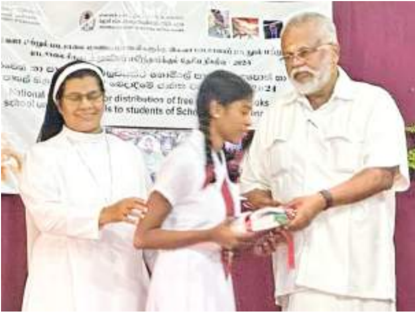
அச்சவேலி யாழ்ப்புணத்தின் தெரேசாள் மகளிர் கல்லூரியில் நடைபெற்ற பிரிவுவள மற்றும் பாடசாலை மாணவ மாணவிகளுக்கு இலவச பாடநூல் மற்றும் பாடசாலை சீருடைத் துணிகள் பகிர்ந்நததில் தேசிய நிகழ்வில் பிரதம விருந்தினராக கட்டுறொழில் அமைச்சர் டக்ளஸ் தேவானந்தா கலந்து கொண்டார். இதன்போது எடுக்கப்பட்ட படங்களை இங்கு காணலாம்.