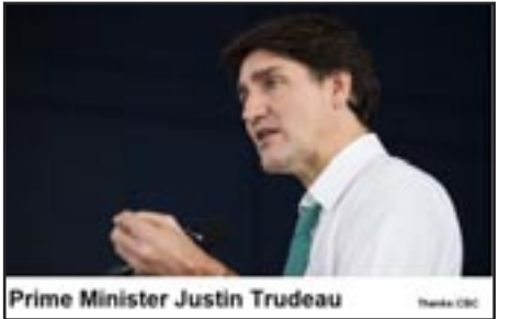
Prime Minister Justin Trudeau