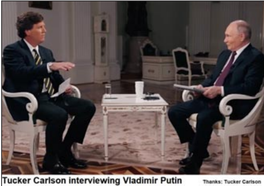
Tucker Carlson interviewing Vladimir Putin

(Volodymyr Zelenskyy) மேற்குலக ஊடகங்கள் மேடை அமைத்துக் கொடுத்தன. ஆனால், எந்த ஒரு மேற்குலக ஊடகவியலாளரும் இந்த மோதலில் ஈடுபட்டுள்ள மற்றொரு நாட்டின் அதிபரான விளாடிமிர் புஷனை நேர்காணல் செய்ய முயலவில்லை” எனக் குறிப்பிட்டிருந்தார். அதற்குப் பல அமெரிக்க மற்றும் ஐரோப்பிய ஊடகவியலாளர் எதிர்ப்புத் தெரிவித்திருந்தனர். அவர்கள் தங்களது நேர்காணலுக்கான அழைப்பை ரஷ்ய அதிபரது அலுவலகம் நிராகரித்து இருந்தது எனத் தெரிவித்திருந்தனர்.