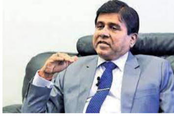
கொள்ளப் பட்டுள்ளன. இலங்கை போன்ற ஒரு சிறிய நாட்டிற்கு இது ஒரு பெரிய தொகையாக கருதப்படுவதாக அவர் மேலும் கூறினார்.

இதேவேளை, குறித்த காலப் பகுதியில் மனைவி அல்லது குழந்தைகளுக்கான ஜீவனாம் சம் தொடர்பான 37, 514 வழக்குகள் விசாரணைக்கு எடுத்துக்