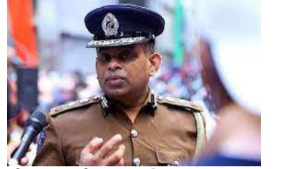
ரின் உதவியுடன் இலங்கைக்கு அழைத்து வரப்படுவார்கள் எனவும் அவர் தெரிவித்துள்ளார்.