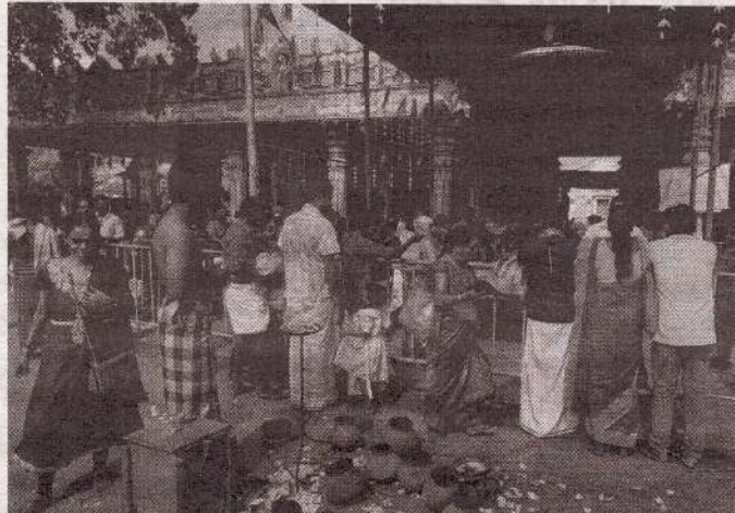
வரலாற்றுச் சிறப்புமிக்க மட்டுவில் பன்றித் தலைச்சி கண்ணகை அம்மன் ஆலயத்தில், பங்குனித் திங்கள் உத்தர உற்சவம் நேற்று திங்கட்கிழமை சிறப்புற நடைபெற்றது. பக்தர்கள் ஆலயக் கேணியில் நீராடிவிட்டு, அம்மனுக்கு பொங்கலிட்டு வழிபாடுகளில் ஈடுபட்டனர். (ப-20-9)

தமிழ் மக்கள் வாழமுடியாத சூழ்நிலைகளை உருவாக்கி அவர்களை மண்ணிலிருந்து வெளியேற்றுவது, தமிழர் அரசியல் பிரதிநிதித்துவத்தை சிதைப்பதும் செயலிழக்கச் செய்வதுமான செயற்பாடுகளை இடைநிறுத்தி தம்மைத் தாமே நிர்வகிக்கக் கூடிய இடைக்கால நிர்வாகப் பொறிமுறை ஒன்றை உடனடியாக உருவாக்கவேண்டும் என்று இந்தியா உட்பட சர்வதேசத் தளப் பரப்பில் முக்கியமான உறுப்பு நாடுகளிடம் கோரிக்கை முன்வைக்கின்றோம் என்று பிரித்தானியத் தமிழர் பேரவை விடுத்துள்ள அறிக்கையில் தெரிவிக்கப்பட்டுள்ளது. (எ-இ)