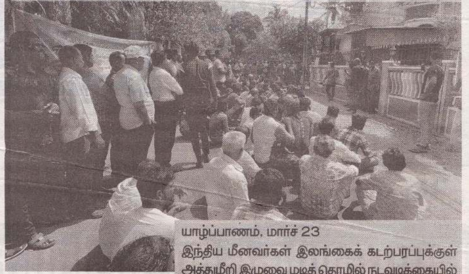
யாழ்ப்பாணம், மார்ச் 23

இந்திய மீனவர்கள் இலங்கைக் கடற்பரப்புக்குள் அத்துமீறி இழுவை மடித் தொழில் நடவடிக்கையில் ஈடுபடுவதற்கு எதிர்ப்புத் தெரிவித்து யாழ்ப்பாணத்தில் உள்ள இந்தியத் துணைத் தூதரகம் யாழ்ப்பாண மாவட்ட மீனவர்களால் நேற்று முற்றுகையிடப்பட்டுள்ளது.