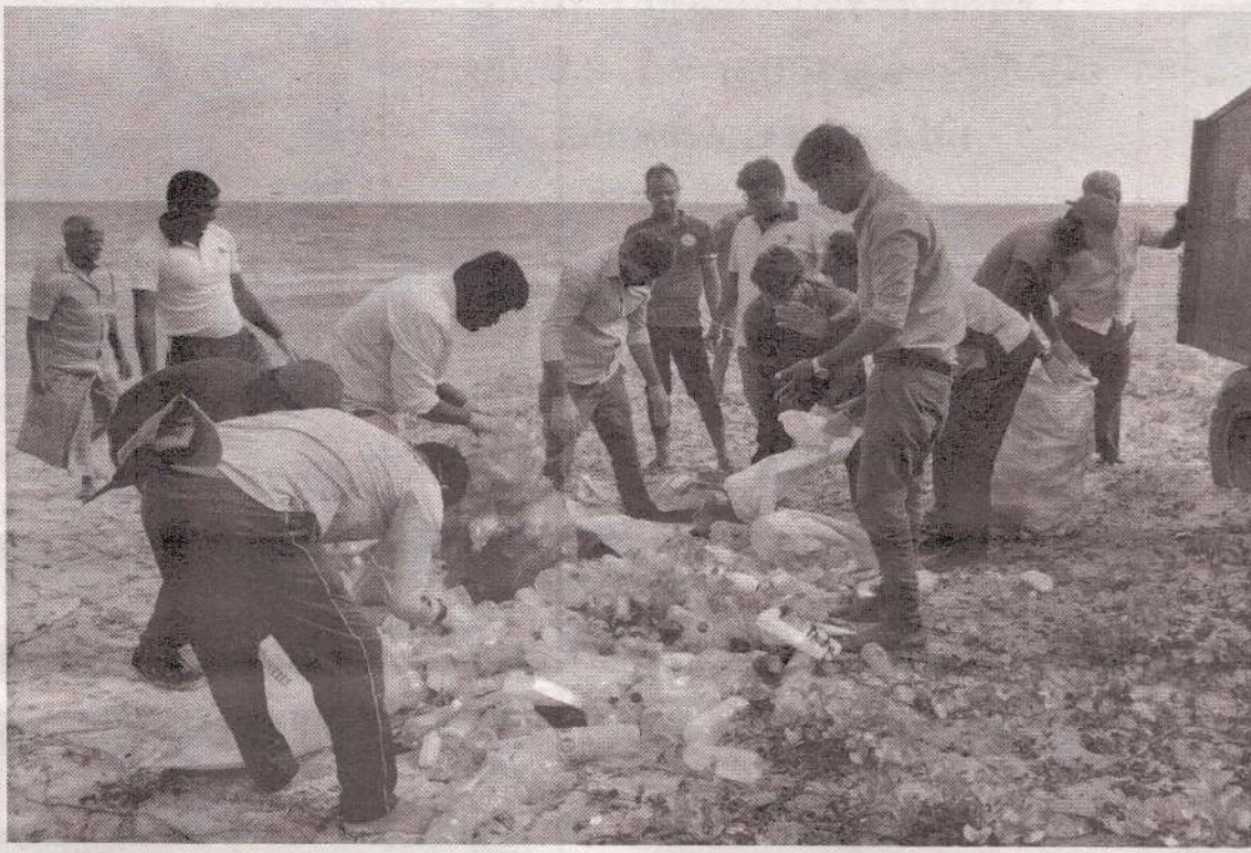
உலக பூச்சிய கழிவு தினத்தை முன்னிட்டு, காரைநகர்ப் பிரதேசசபையின் ஏற்பாட்டில் முன்னெடுக்கப்பட்ட கடற்கரையோரச் சுத்தப்படுத்தல் செயற்றிட்டத்தின் ஆரம்ப நிகழ்வு காரைநகர் ககரினாக் கடற்கரையில் நேற்று முன்தினம் வியாழக்கிழமை இடம்பெற்றது. நிகழ்வில் ககரினாக் கடற்கரை தொடக்கம் தீர்த்தக்கரை வரையான பகுதிகளில் பிளாஸ்டிக் முதலான பெருமளவு கழிவுகள் சேகரிக்கப்பட்டு திண்மக்கழிவு தரம்பிரிக்கும் நிலையத்துக்குக் கொண்டு செல்லப்பட்டன. (ப-66)