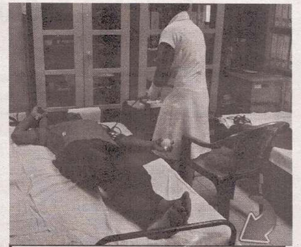
சர்வதேச நீர் தினத்தை முன்னிட்டு, தேசிய நீர் வழங்கல் வடிகாலமைப்புச்சபையின் யாழ்ப்பிராந்திய அலுவலகத்தில் குருதிக்கொடை முகாம் ஒன்று கடந்த புதன்கிழமை இடம்பெற்றது. (ப-214)