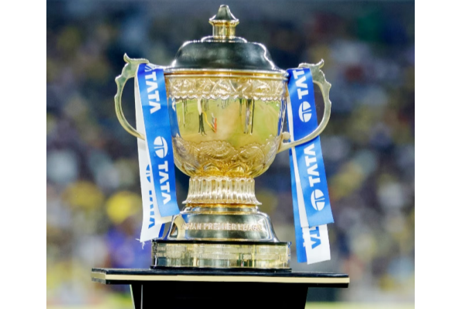
மும்பை, பெப். 17

ஐ. பி. எல். 2024ஆம் ஆண்டுக்கான தொடர் பெரும்பாலும் மார்ச் மாத இறுதியில் ஆரம்பமாகும். இந்தியா வில்தான் தொடர் நடைபெறும் என்று அதன் தலைவர் அருண் துமால் தெரிவித்துள்ளார்.