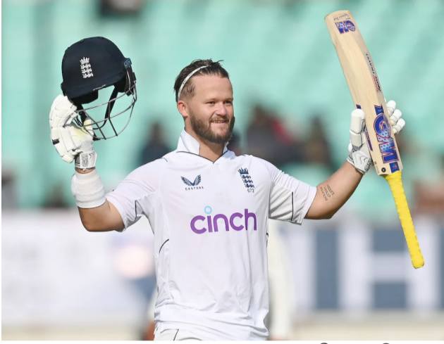
ராஜ்கோட், பெப். 17

இந்தியாவுக்கு எதிரான மூன்றாவது டெஸ்டில் முதல் இன்னிங்ஸில் துடுப்பெடுத்தாடி வரும் இங்கிலாந்து அணி 2 விக்கெட்கள் இழப்புக்கு 207 ஓட்டங்களை குவித்துள்ளது.