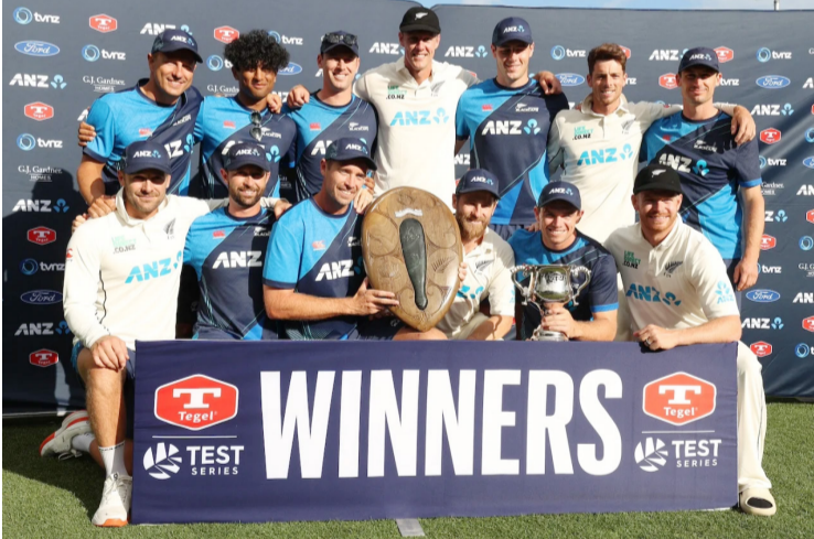
ஹமில்டன், பெப். 17

தென்னாபிரிக்க அணியை 7 விக்கெட்களால் அபாரமாக வீழ்த்தியது நியூசிலாந்து அணி. இதன் மூலம் 2 போட்டிகள் கொண்ட டெஸ்ட் தொடரை முழுமையாக வென்றது நியூசிலாந்து. தென்னாபிரிக்கா - நியூசிலாந்தின் 92 வருட டெஸ்ட் வரலாற்றில் தொடரை முழுமையாக நியூசிலாந்து வென்றிருப்பது இதுவே முதல் தடவையாகும்.