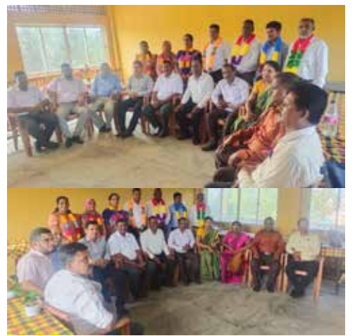
பாடசாலைகளின் அதிபர்கள் மற்றும் பிரதி, உதவி அதிபர்கள் கலந்து கொண்டனர். (05)