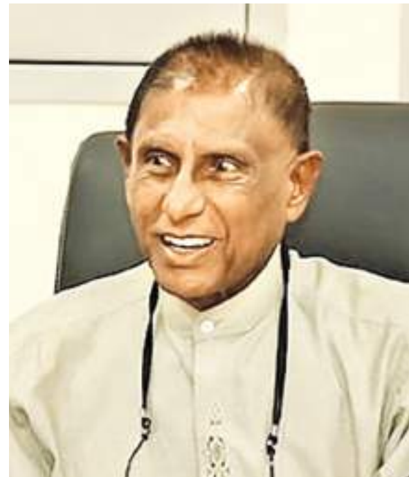
சவால்கள் எழுகின்ற போதெல்லாம் கட்சித் தலைமையுடன் கலந்துரையாடி பிரச்சினைகளைத் தீர்ப்பது அவரது பழக்கமாக இருந்தது. பாராளுமன்றத்தில் சிறந்த பேச்சாளராக திகழ்ந்த அவர், ஐ.தே. கட்சியின் தொடர்புடைய தொழிற்சங்கங்களில் முக்கிய பங்காற்றினார்.

அந்தக் காலப்பகுதியில் அவர் எடுத்த சிறந்த முடிவுகளினால் வடமேற்கு மாகாணத்தில் ஐக்கிய தேசியக் கட்சியின் அடையாளமாக ஜயவிக் கிரம என்ற நாமம் அமைந்தது. அவர் 1941 ஆம் ஆண்டு ஜனவரி 29 ஆம் திகதி குருநாகல் மாவட்டத்தின் சத்கேரோணை கட்டுவெல்லம மற்றும் கிரீஉல்ல என்பவற்றில் வித்தித் தெரவில் வெற்றி பெற்று முதலமைச்சரானார். வடமேற்கு மாகாணத்தில் மே 4, 1988 முதல் ஒக்டோபர் 19, 1993 வரை அவர் முதலமைச்சராகப் பணியாற்றினார்.