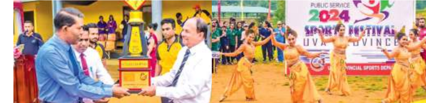
டனர். அதேவேளை கலாசார திணைக்கள அலுவலர்களின் நடனம், அரச உத்தியோகத்தர்கள் கலை, கலாசார நிகழ்வுகளும் இடம்பெற்றமை குறிப்பிடத்தக்கது.

ஊவா மாகாண சபை அமைச்சு, விளையாட்டுத் திணைக்களமும் ஏற்பாடு செய்த 2024 ஊவா மாகாண பொது சேவை விளையாட்டு விழா கடந்த 13 ஆம் திகதி பதுளை கால்பந்து மைதானத்தில் ஆரம்பமானது. எதிர்வரும் 29 ஆம் திகதி விளையாட்டுவிழாவின் நிறைவு நிகழ்வுகள் இடம்பெறவுள்ளன.