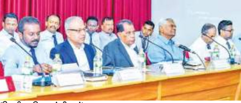
(வெலிகம தினகரன் நிருபர்)

மாத்தறை மாவட்ட செயலக நிகழ்வில் சாகவ ரத்னாயக்க