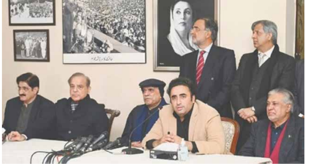
பிபிபி கட்சியும் சிறிய கட்சிகளுடன் இணைந்து ஆட்சியமைக்க முடிவு செய்தன. இருந்தாலும், இது தொடர்பாக பல கட்டங்களாக நடந்த பேச்சுவார்த்தையில் உடன்பாடு

கடந்த 8 ஆம் திகதி நடைபெற்ற நாடாளுமன்றத் தேர்தலில் முன்னாள் பிரதமர் இம்ரான் கானின் பாகிஸ்தான் தெஹ்ரீக்-ஏ-இன்சாஃப் (பிடிஐ) கட்சியின் ஆதரவு பெற்ற சுயேச்சை வேட்பாளர்கள்தான் மிக அதிக இடங்களைக் கைப்பற்றினர். இருந்தாலும், பெரும்பான்மை இல்லாததால் ஆட்சியமைக்கப்போவதில்லை என்று இம்ரான் கூறிவிட்டார். அதையடுத்து, 2 மற்றும் 3 ஆவது இடங்களைப் பிடித்த பிஎம்எல்-என் கட்சியும்,