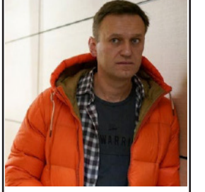
சுரையல் அடித்துக் கொல்லப்பட்ட நவலன்