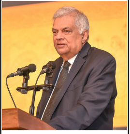
வந்தூர் உடன்படிக்கைகளில் ஆர்வம் காட்டும் இலங்கை