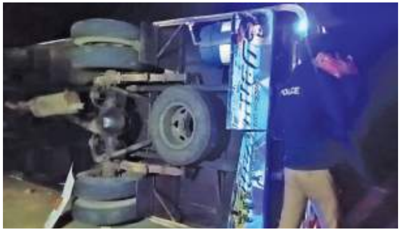
(தலவாக்கலை குறுப்பு நிருபர்)

ரதெல்ல குறுக்கு வழி வீதியில் பஸ் குடைசாய்ந்து விபத்து; 8 பேர் காயம்