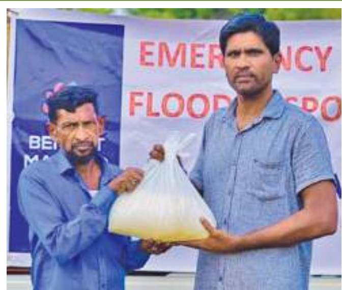
கந்தளாய் பிரதேசத்தில் வறுமைக்கோட்டின் கீழ் வாழ்கின்ற குடும்பங்களுக்கு உற் உணவுப்பொதிகள் வழங்கி வைக்கப்பட்டன. அல் ஹிக்மா பவுண்டேசன் அமைப்பினால் கிந்த உலருணவுப் பொருட்கள் வழங்கி வைக்கப்பட்டன.