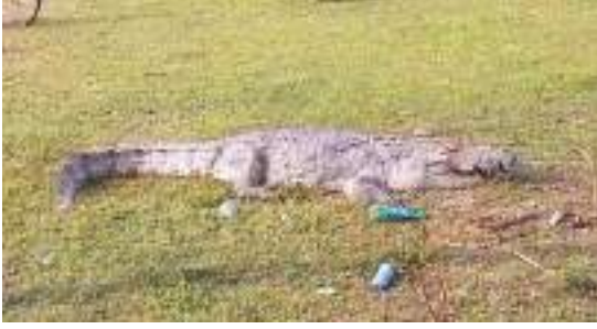
(வாசிக்குடா விஷேட நிருபர்)

அம்பாறை திருக்கோவில் பொலிஸ்பிரிவுக்குட்பட்ட திருக்கோவில் 03 பிரதேசத்தில் நேற்றுமுன்தினம் (22) இரவு ஊருக்குள் புகுந்த முதலையொன்றை பிரதேசவாசிகள் மடக்கி பிடிக்கும் முயற்சியில் ஈடுபட்டனர். ஊருக்குள் புகுந்த முதலை தொடர்பில் பொலிஸாருக்கும் வன