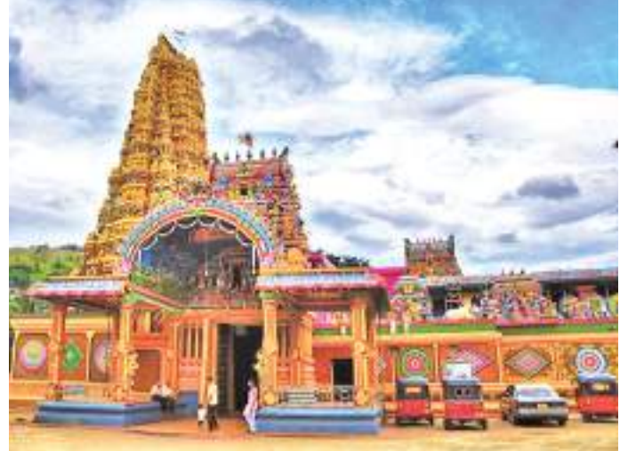
மாத்தளை சுழற்சி நிருபர்

மாத்தளை அருள்மிகு ஸ்ரீமுத்துமாரியம்மன் தேவஸ்தான மாசிமக மகோற்சவத்தின் பஞ்சரத பவனி இன்று (24) மிகச் சிறப்பாக நடைபெறுவதுடன், விசேட மண்டப பூஜைகளைத் தொடர்ந்து முற்பகல் 11.00 மணியளவில் உற்சவ மூர்த்திகள் தேரில் எழுந்தருளி பக்தர்களுக்கு அருள் பாலிப்பார்கள். இந்நிலையில் நாளை மறுதினம் (26) காலை 7.00 மணிக்கு பாரகுட பவனியும் அதனைத் தொடர்ந்து தீர்த்தோற்சவமும் நடைபெறும். 27ஆம் திகதி காலை ஸ்ரீசண்டேஸ்வரி உற்சவமும் 06