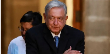
மெக்சிக்கோசிறி, பெப். 28

ஊடகவிலாளர்களின் தனிப்பட்ட தொலைபேசி எண்களை பகிரங்கப்படுத்தும் திட்டத்திற்கு மெக்சிக்கோ ஜனாதிபதி அன்ரீஸ் இம்மனுவல் ஆதரவு வழங்கியுள்ளார்.