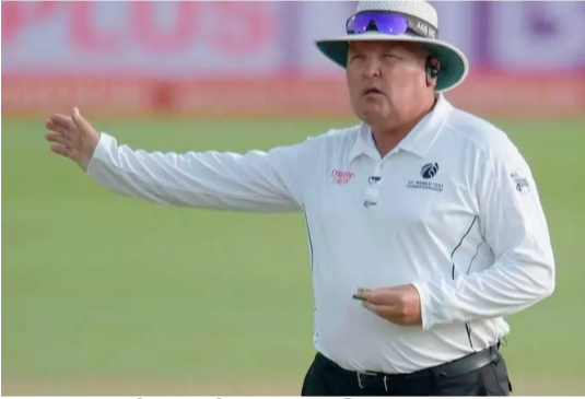
பணியாற்றினார். தற்போது வரை நூற்றுக்கும் மேற்பட்ட சர்வதேச கிரிக்கெட்டில் நடுவராக பணி

2006ஆம் ஆண்டு இவர் தனது முதல் சர்வதேச கிரிக்கெட் போட்டியில் நடுவராகப்