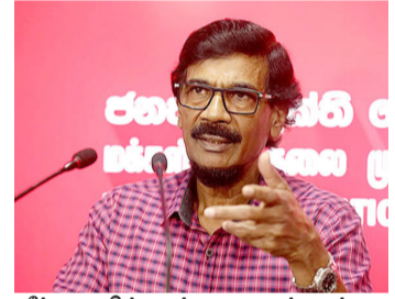
தீர்மானித்துள்ளது என்றும் தெரிவித்தார். அரசமைப்பு பேரவையின் தீர்மானம் ஜனாதிபதிக்கு தெரிவிக்கப்பட்ட பின்னரும்

இந்தக் குற்றச்சாட்டை முன்வைத்த அந்தக் கட்சியின் பொதுச்செயலாளர் ரில்வின் சில்வா இந்த விவகாரம் தொடர்பில் நீதிமன்றம் செல்வதற்குத் தமது கட்சி