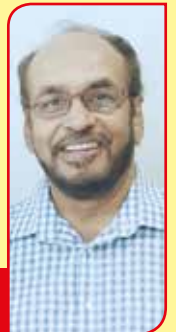
கதை வசனம் ஒளிப்பதிவு இயக்கம் கண்ணா B.F.A

காட்சிகள் யாவும், சரித்திர பின்னணியிலும், படமாக்கப்பட்டுள்ளது.