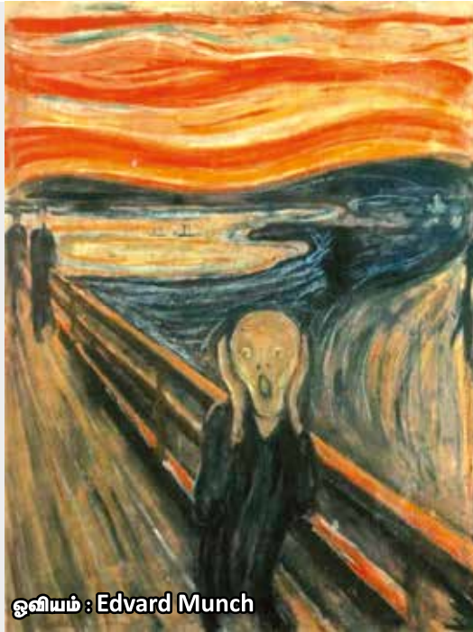
ஓவியம் : Edvard Munch

மனிதர்களின் உளவியலை ஒருவகைய உணர்வுக்கு உட்பட்டதாக வைத்திருப்பதற்கு அதிகார சக்திகள் கைக்கொள்கின்ற உத்திதான் இந்த அச்சக் கலாச்சாரம். எதிர்மறையான விளைவுகளை எதிர்கொள்ள நேரும் என்ற பயத்தினால் வெளிப்படையாகத் தமது கருத்துகளைச் சொல்வதற்குத் தயங்கித்