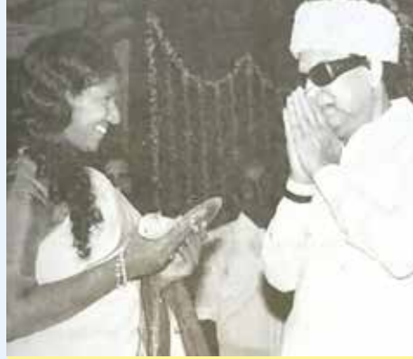
காலந்தோறும் நாட்டியக்கலை எனும் நூலுக்கு 1982 ஆம் ஆண்டிற்கான தமிழக அரசின் முதற்பரிசை தமிழக முதலமைச்சர் எம்.ஜி. இராமச்சந்திரன் அவர்கள் வழங்குகிறார்