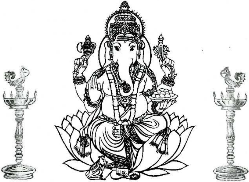
ஓம் லம்போதராய நமஹ

ஐந்து கரத்தனை ஆனை முகத்தனை இந்தி னிளம்பிறை போலுமெயிற்றனை நந்தி மகன்றனை ஞானக் கொழுந்தினைப் புந்தியில் வைத்தடி போற்றுகின்றேனே.