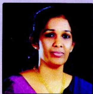
Hon. State Minister of Education Mrs. Vijayakala Maheswaran