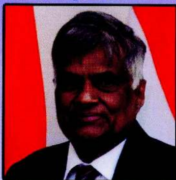
Hon'ble Prime Minister Ranil Wickremesinghe