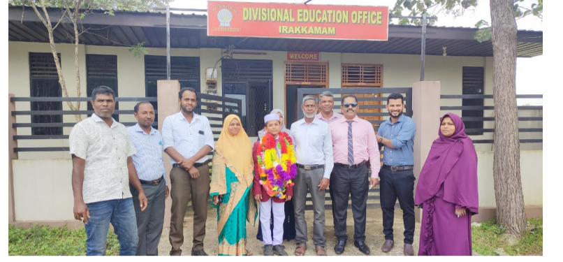
கம் பிரதேச சபை கோட்ட பாடசாலைகள் மற்றும் தனி யார் நிறுவனங்கள் கடைகள்