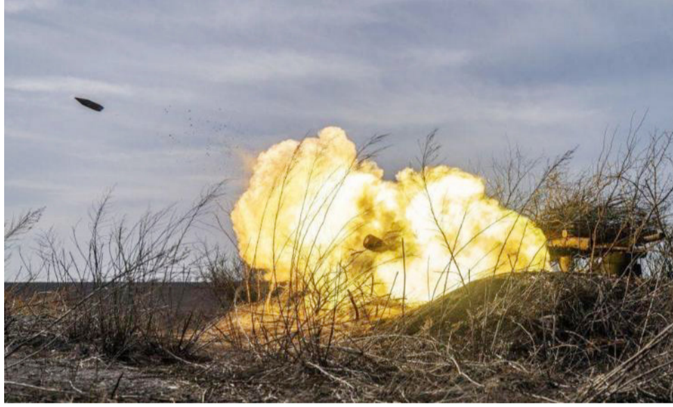
மேம்படுத்த" ஒரு தந்திரத்தைப் பயன்ப டுத்துகிறார் என்று நம்புகிறார். "பிரான்ஸ் அல்லது வேறு எந்த நேட்டோ நாடும் உக்ரேன் போர்க்களத் திற்கு துருப்புக்களை அனுப்புவது சாத்தி