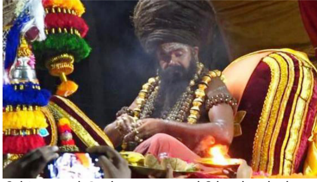
மிரட்டுவதாகவும் இதன் காரணமாக மடத்தில் உள்ளவர்கள் மன உளைச்சலில் இருப்பதால், இது தொடர்பாக நடவடிக்கை எடுக்க வேண்டும் எனவும் புகார் அளித்திருந்தார்.