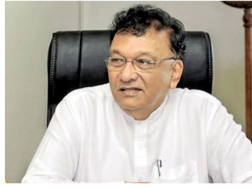
ரங்களை வழங்கக் கூடாது என்பதில் உறுதியாக இருக்கிறார்.

அதற்காக அவர் தேசிய காணி ஆணைக் குழு, தேசிய பொலிஸ் ஆணைக்குழு ஆகியவற்றை நிறுவ வேண்டும் என்ற பரிந்துரைகளையும் அவரே மேற்கொண்டிருந்தார். ஆனால், அவர் தற்போது 13ஆவது திருத்தச் சட்டம் சம்பந்தமாக தனது கொள்கையை மாற்றிவிட்டார் என்பது மிகத் தெளிவாக தெரிகிறது. விசேடமாக, அவர் மாகாண சபைகளுக்கு பொலிஸ் அதிகாரங்களை வழங்கக் கூடாது என்பதில் உறுதியாக இருக்கிறார்.