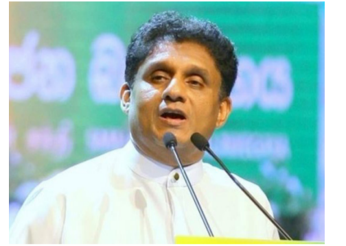
உடன்படிக்கைகள் கைச்சாத்திடப்படலாம் டொலர்களைப் பெற்றுக் கொள்ள முடியாது போகும்.

இதைத் தொடர்ந்து மீண்டும் சென்னை சென்ற அவர் உடல்நிலை பாதிக்கப்பட்டு நேற்று முன்தினம் மருத்துவமனையில் சேர்க்கப்பட்டார் என்பது குறிப்பிடத்தக்கது. (ஐ)