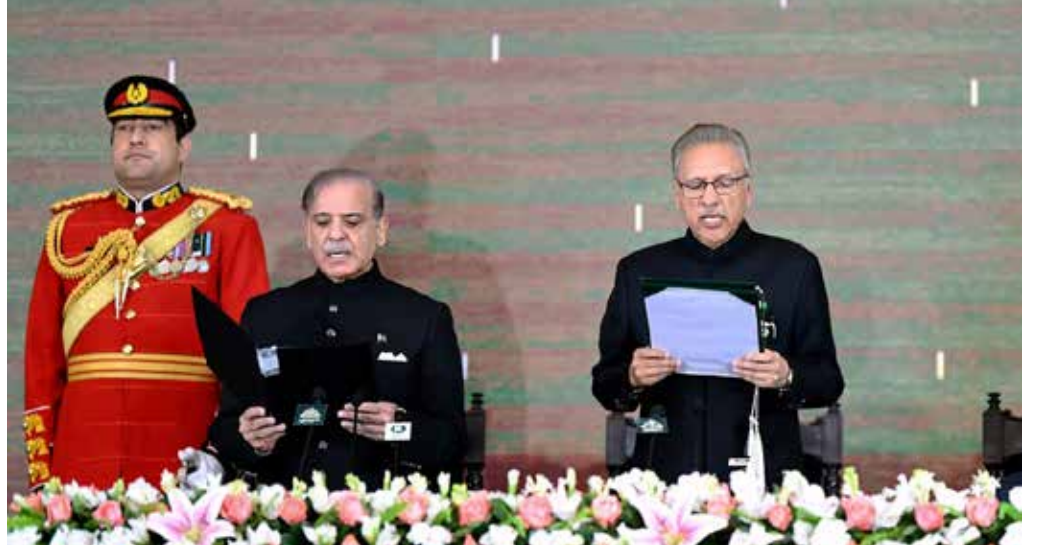
வாழ்த்துத் தெரிவித்துள்ள இந்தியப் பிரதமர் நரேந்திர மோடி, "பாகிஸ்தானின் பிரதமராக பதவியேற்ற ஷாபாஸ் ஷெரீஃப்வுக்கு வாழ்த்துகள்" என்று தனது எக்ஸ் தளப் பக்கத்தில் பதிவிட்டுள்ளார். (04)

இந்நிலையில், பாகிஸ்தான் பிரதமராக 2 வது முறையாக பதவியேற்றுள்ள ஷாபாஸ் ஷெரீஃப்வுக்கு வாழ்த்துத் தெரிவித்துள்ள இந்தியப் பிரதமர் நரேந்திர மோடி, "பாகிஸ்தானின் பிரதமராக பதவியேற்ற ஷாபாஸ் ஷெரீஃப்வுக்கு வாழ்த்துகள்" என்று தனது எக்ஸ் தளப் பக்கத்தில் பதிவிட்டுள்ளார். (04)