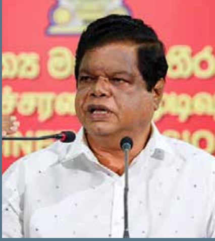
வளாகங்களில் அரசியல் செயற்பாடுகள் முன்னெடுக்கப்படுவதால் மாணவர்

களின் கற்றல் செயற்பாடுகளுக்கு இடையூறு ஏற்படுவதாகப் பல்வேறு தரப்பிடமிருந்து முறைப்பாடுகள் முன்வைக்கப்பட்டுள்ளன.