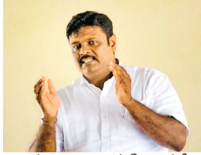
வாழ்க்கையை வாழத் தொடங்கினார்.

விடுதலை செய்யப்பட்ட ஏழு பேரில் 3 பேர் இந்திய குடியரிமை கொண்டவர்கள். இந்திய குடியரிமை கொண்டவர்களாக இருந்த மையால் அவர்கள் இயல்பு