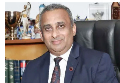
படுத்தியுள்ளது என இலங்கை சட்டத்தரணிகள் சங்கம் தெரிவித்துள்ளது.

இவ்வாறான சூழ்நிலையில் தேசபந்து தென்னக்கோனை பொலிஸ்மா அதிபராக நியமித்துள்ளமை கரிசனையை ஏற