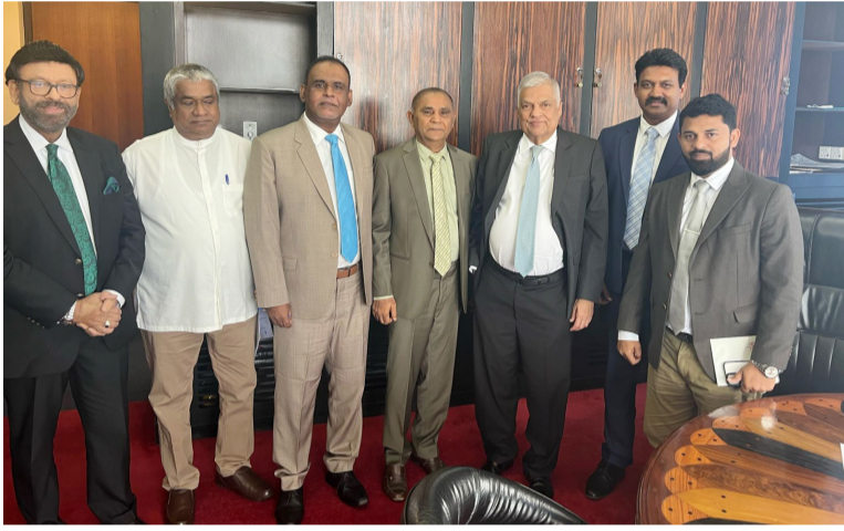
தாக தீர்வு எட்டப்பட்டுள்ளது.

இவற்றில் பல விடயங்களுக்கு முழுமையான தீர்வும், சில விடயங்களுக்கு துறைசார்ந்த அமைச்சர்கள், அதிகாரிகளுடன் கலந்துரையாடி முடிவெடுப்ப